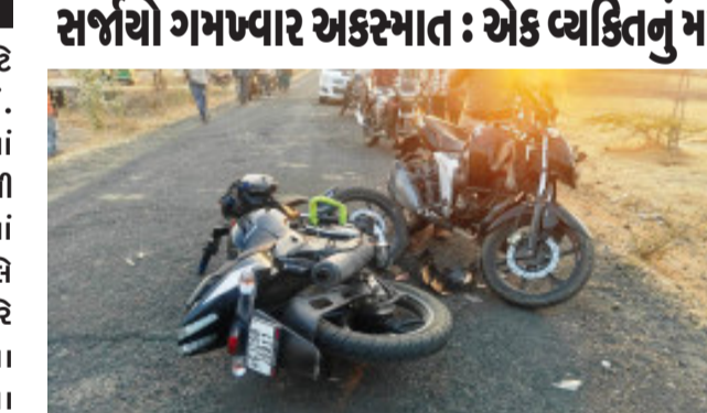
ઝાલોદ, અકસ્માતમાં બચી ગયેલ વ્યક્તિને દાહોદ ઝાચડસ હોસ્પિટલ ખાતે સારવાર હેઠળ દાહોદ જીલ્લાના ઝાલોદ તાલુકાના ગરાડુ ગામનાં કજેળી ફળિયા માંથી બે બાઈક GJ-20-BJ-0911 અને GJ-20-BF-0997 નંબરની બાઈકો સામસામે અથડાતાં એકનું ઘટનાસ્થળે મોત અને એકને વધુ સારવાર અર્થે દાહોદ ઝાચડસ હોસ્પિટલ ખાતે ખસેડવામાં આવ્યો હતો.