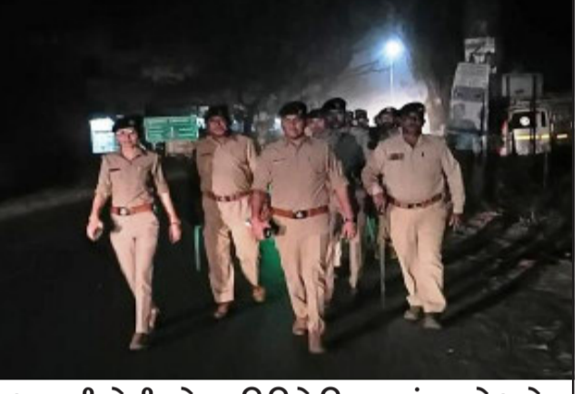
આગામી હોળી તહેવાર નિમિત્તે વિસ્તારમાં કાયદો અને વ્યવસ્થા જળવાઈ રહે તે માટે મલેકપુર બજારમાં ફૂટ પેટ્રોલિંગ કરવામાં આવ્યું.

હિટવેવથી રક્ષણ પૂરું પાડવા કેટલાક દિશા નિર્દેશો સૂચિત કરવામાં આવ્યા છે. જેમાં