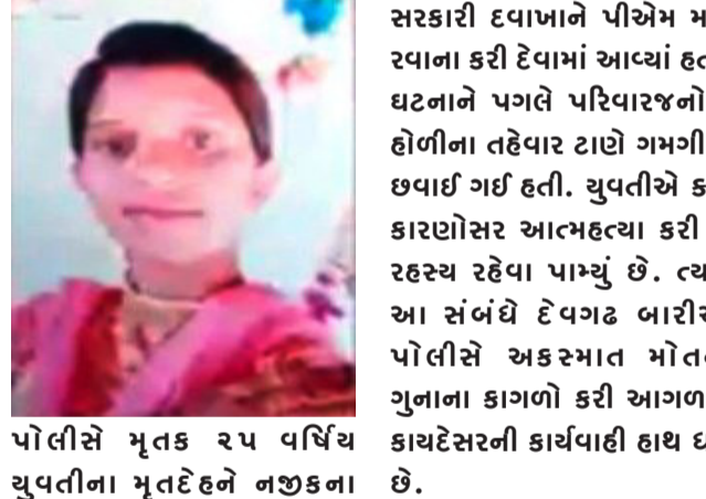
પોલીસે મૃતક ૨૫ વર્ષીય યુવતિના મૃતદેહને નજીકના સરકારી દવાખાને પીએમ માટે રવાના કરી દેવામાં આવ્યાં હતાં. ઘટનાને પગલે પરિવારજનોમાં હોળીના તહેવાર ટાણે ગમગીની છવાઈ ગઈ હતી. યુવતિએ ક્યાં કારણોસર આત્મહત્યા કરી લે રહ્યું રહેવા પામ્યું છે. ત્યારે આ સંબંધે દેવગઢ બારીયા પોલીસે અકસ્માત મોતના ગુનાના કાગળો કરી આગળની કાયદેસરની કાર્યવાહી હાથ ધરી છે.

દાહોદ, દાહોદ જીલ્લાના દેવગઢ બારીયા નગરમાં એક ખાનગી હોસ્પિટલમાં ફરજ બજાવતી એક ૨૫ વર્ષીય યુવતિએ હોસ્પિટલમાં અગમ્યકારણોસર ગળાફાંસો ખાઈ આત્મહત્યા કરી લેતાં હોસ્પિટલ આલમમાં સ્તબ્ધતા સાથે ચકચાર મચી જવા પામી હતી. ઘટનાની જાણ પરિવારજનો તેમજ સ્થાનિક પોલીસને થતાં તમામ લોકો ઘટના સ્થળે દોડી આવ્યાં હતાં. ઘટનાને પગલે સ્થળ પર લોકટોળા ઉમટી પડ્યાં હતાં.