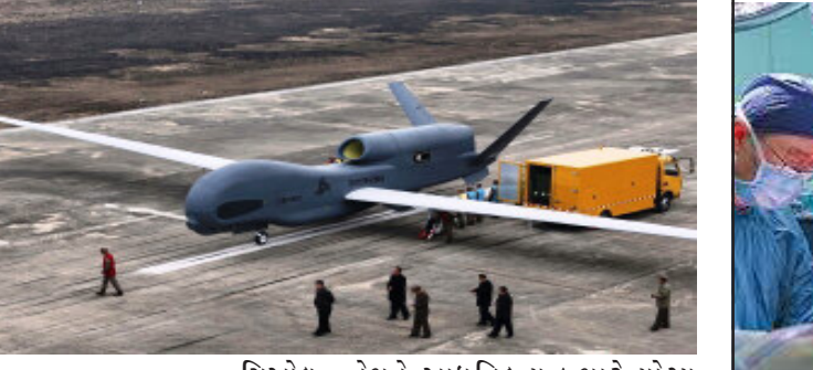
સિઓલ ઉત્તર કોરિયા પોતાની લશ્કરી ક્ષમતાઓ વધારવામાં વ્યસ્ત છે. સરમુખત્યાર કિમ જોંગ ઉન નવા હુમલા અને જાસૂસી ડ્રોનની શક્તિનું મૂલ્યાંકન કરે છે. તેમણે નવા ડ્રોનના પરીક્ષણનું અવલોકન કર્યું. આ ઉપરાંત તેમણે ડ્રોનનું ઉત્પાદન વધારવાની વાત કરી.

ઉત્તર કોરિયાની સત્તાવાર કોરિયન સેન્ટ્રલ ન્યૂલ એજન્સી દ્વારા જાહેર કરાયેલી તસવીરોમાં, કિમ જોંગ એક મોટા રિકોનિસન્સ ડ્રોનનું નિરીક્ષણ કરતા જોવા મળે છે. આ ડ્રોન બોઈંગના ઈ-૭ વેજેટલ એરબોર્ન ચેટવહી અને નિર્ધનશૂન વિમાન જેવું લાગે છે. પરીક્ષણ દરમિયાન, રિકોનિસન્સ ડ્રોનની જમીન અને સમુદ્ર પર અનેક લક્ષ્યોને ટ્રેક કરવાની અને લશ્કરી પ્રવૃત્તિઓ પર નજર રાખવાની ક્ષમતાનું મૂલ્યાંકન કરવામાં આવ્યું હતું. એજન્સીએ જણાવ્યું હતું કે, ડ્રોન ટેકનોલોજી સંકુલ અને ઈલેક્ટ્રોનિક ડ્રુઇ સંશોધન જૂથની મુલાકાત દરમિયાન, કિમ જોંગ ઉને ડ્રોનના પ્રદર્શનથી સંતોષ વ્યક્ત કર્યો હતો અને ઉત્પાદન વધારવાની યોજનાને મંજૂરી આપી હતી. તેમણે કહ્યું કે સશસ્ત્ર દળોને આગળ વધારવા અને