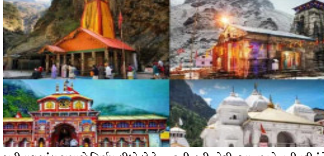
દહેરાદુન ઉત્તરાખંડમાં ચારધામ યાત્રા આ વર્ષે ૩૦ એપ્રિલથી શરૂ થઈ રહી છે. દર વર્ષે લાખો શ્રદ્ધાળુઓ આ યાત્રા પર આવે છે. આ વખતે ચારધામ યાત્રામાં કેટલાક નવા નિયમો બનાવવામાં આવ્યા છે. સોશિયલ મીડિયા પર વીડિયો અને રીલ બનાવનારાઓ માટે ખાસ નિયમો છે. મંદિરની અંદર વીડિયો અને રીલ બનાવવા પર પ્રતિબંધ છે. જો તમે આમ કરશો તો તમને દર્શન કર્યા વિના જ પાછા મોકલી દેવામાં આવશે. આ ઉપરાંત વીઆઈપી દર્શન પણ બંધ કરી દેવામાં આવ્યા છે.

આ વખતે ચારધામ યાત્રા માટે ૯ લાખ લોકોએ રજીસ્ટ્રેશન કરાવ્યું છે. યાત્રાને સુરક્ષિત બનાવવા માટે ઘણી વ્યવસ્થા કરવામાં આવી છે. કેદારનાથ બંદીનાથ પાંડા સમાજે નિર્ણય લીધો છે કે આ વખતે યાત્રા દરમિયાન રીલ બનાવનારાઓને મંદિરમાં પ્રવેશવા દેવામાં આવશે નહીં. ગયા વર્ષે મુસાફરો દ્વારા વીડિયો બનાવવાને કારણે ઘણી જગ્યાએ સ્થિતિ બગાડી હતી. કેદારનાથ ધામમાં માત્ર વીડિયો બનાવવા માટે ઢોલ વગાડવામાં આવી રહ્યા હતા. જેના કારણે પ્રકૃતિ અને ભક્તોની શાંતિ ખોરવાઈ