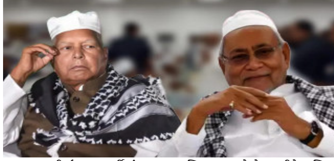
લાલુ યાદવની ઈફતાર પાર્ટીમાં ભાગ લઈને પોતાના રાજકીય ઈરાદા જાહેર કર્યા છે. આવી સ્થિતિમાં, લાલુ યાદવે વક્ક બિલના વિરોધમાં ભાગ લઈને સ્પષ્ટ કરી દીધું છે કે તેઓ મુસ્લિમો સાથે જોડાયેલા મુદ્દાઓ પર ખુલ્લેઆમ ઉભા છે. મુસ્લિમ મતો મેળવવાના આ ખેલ દરમિયાન, શું લાલુ યાદવે નીતિશ કુમારને અલગ કરી દીધા છે?

વક્ક બિલને કારણે મુસ્લિમ સમુદાય નીતિશ કુમારથી નારાજ છે.