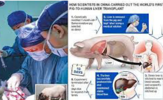
બેઈજિંગ ચીની ડોક્ટરોએ કંઈક એવું અદ્ભુત કામ કર્યું છે જેને તબીબી ક્ષેત્રે ચમત્કાર કહી શકાય. ચીની ડોક્ટરોએ પહેલી વાર આનુવંશિક રીતે સુધારેલા ડુક્કરના લીવરનું માનવ શરીરમાં ટ્રાન્સપ્લાન્ટ કર્યું છે. આ ટ્રાન્સપ્લાન્ટ એક ઊંચા ૩૩ વ્યક્તિ પર કરવામાં આવ્યું છે. ડોક્ટરોની આ સિદ્ધિ ભવિષ્યમાં દર્દીઓની સારવારમાં મદદ કરશે. ઇલ્લા કેટલાક વર્ષોમાં, ડુક્કરને મનુષ્યો માટે શ્રેષ્ઠ અંગ દાતાઓમાંના એક તરીકે જોવામાં આવે છે. અમેરિકન ડોક્ટરોએ નાજરમાં ડુક્કરની ડિઝીઝી અને હૃદય ટ્રાન્સપ્લાન્ટ કરવામાં સફળતા મેળવી છે.

ચીનીના શીઆનમાં આવેલી મિલિટરી મેડિકલ યુનિવર્સિટીના ડોક્ટરોએ નેચર જર્નલમાં પ્રકાશિત થયેલા એક અભ્યાસમાં આ સફળતાની જાણ કરી છે. માનવ શરીરમાં ડુક્કરના લીવરનું પરીક્ષણ પહેલાં ક્યારેય કરવામાં આવ્યું ન હતું. આ ટ્રાન્સપ્લાન્ટ પછી, સંશોધકોને આશા છે કે જીન-સંશોધિત ડુક્કર ગંભીર રીતે બીમાર દર્દીઓને ઓછામાં ઓછી કામચલાઉ રાહત આપી શકે છે.