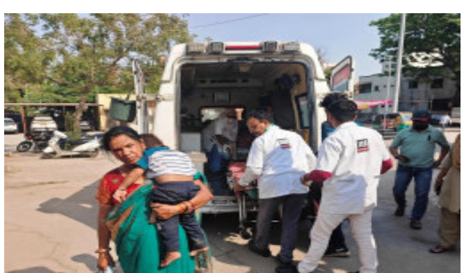
બાળકીઓની સ્થિતિ ગંભીર અન્ય હોસ્પિટલમાં ખસેડવામાં આવી.

પાવાગઢ, પાવાગઢ ખાતે મહાકાળી માતાજીના દર્શન કરવા આવેલ સાવલી તાલુકાના તુલસીપુરા ગામના વ્યક્તિ પરિવાર સાથે દર્શન કરી પરત ફરી રહ્યા હતા. ત્યારે ખાખરીયા કેનાલ પાસે અજાણ્યા વાહન ટકકર મારી હતી. ચાલક અને ચાર બાળકો રોડ ઉપર પટકાતા ઈજાઓ થતાં સારવાર માટે હાલોલ સરકારી હોસ્પિટલમાં ખસેડવામાં આવ્યા. જ્યાં ત્રણ