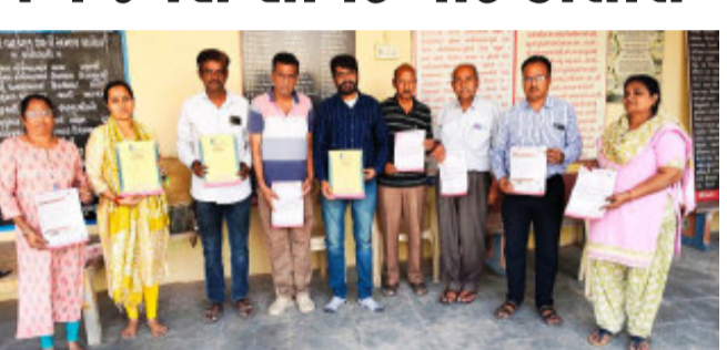
ગુજરાત બ્રહ્મસમાજ રાજ્યકક્ષા દ્વારા ગુજરાતમાં ભગવાન પરશુરામની વિશ્વની સો થી ઊંચી પ્રતિમા પણ સ્થાપવામાં આવશે. આ પ્રોજેક્ટ અંતિમ ચરણમાં છે. બીજી એવી પણ માહિતી આપી હતી કે, શ્રી સમસ્ત