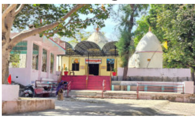
મહાદેવનું મંદિર પણ શિવભક્તો માટે શ્રદ્ધા અને આસ્થાન પ્રતીક છે, આ પૌરાણિક કેઝર મહાદેવના મંદિર ખાતે શિવરાત્રીના દિવસે સ્થાનિક જીલ્લા સહિત રાજ્યભર

શહેરા, શહેરા સહિત સમગ્ર જીલ્લામાં શિવરાત્રીને લઈને આજે શિવાલયો બમ: બમ; ભોલેનાથ નાંદેથી ગુંજી ઊઠવા સાથે સવારથી જ મહાદેવની પૂજા અર્ચના કરવા માટે ભક્તોની ભીડ જોવા મળનાર છે. જ્યારે પાનમ કેમ ખાતે આવેલ કેઝર મહાદેવના મંદિરે દર્શનાર્થે ભક્તોની ભીડ જોવા મળવા સાથે પરંપરા મુજબ મેળો ભરાય છે. શહેરા પહેલા શિવનગરી તરીકે ઓળખાતું હોવા સાથે અનેક નાના મોટા શિવાલયો પણ આવેલા છે. જેમાંથી એક પાનમ કેમ ખાતે કેઝર