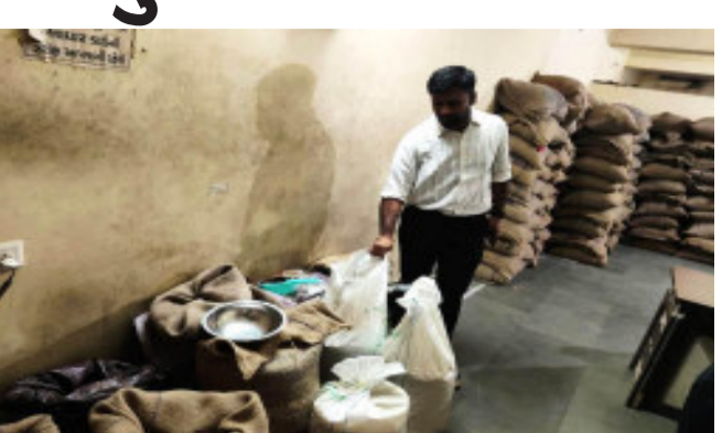
હાલોલ તાલુકામાં આવેલ સરકાર માન્ય વ્યાજબી ભાવની દુકાનમાં આકસ્મિક તપાસ હાથ ધરવામાં આવી હતી. તપાસ દરમિયાન લાભાર્થીને કુપન ન આપવી,