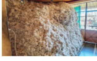
રૂ.૧,૫૦૦થી લઈ રૂ.૭,૨૦૦ સુધીનો હોવાનું મનાઈ રહ્યું છે. જેથી ખેડૂતો વેપારીઓને કપાસ વેચે તો ઘણું જ મોટું આર્થિક નુકસાન થઈ શકે તેમ હોવાથી ખેડૂતો પણ સત્વરે આ સમસ્યા દૂર થાય અને જલ્દીથી કપાસની ટેકાના ભાવથી ખરીદી શરૂ થાય એવી માંગ કરી રહ્યા છે. કપાસના બજાર ભાવ ઘણા નીચા

છોટા ઉદેપુર સીસીઆઈ દ્વારા ચાર દિવસથી કપાસ ખરીદીના બિલ ન બનતાં કપાસની ખરીદી બંધ કરાઈ છે. જેના કારણે હાલ સંખેડા-બોડેલી તાલુકામાં ખેડૂતો ઘરોમાં કપાસનો સંગ્રહ કરવા મજબૂર બન્યા છે. છેલ્લા ચાર દિવસથી સીસીઆઈ દ્વારા કપાસ ખરીદીના બિલ ન બનતાં હોવાને કારણે કપાસની ખરીદી બંધ કરાયેલી છે. કપાસની ખરીદી બંધ થયેલી હોવાને કારણે ખેડૂતોનો કપાસ ખરીદાતો નથી. ટેકાનો ભાવ ૭,૪૭૧ રૂપિયા પ્રતિ ક્વિન્ટલ છે. જ્યારે બજારમાં વેપારીઓનો ભાવ