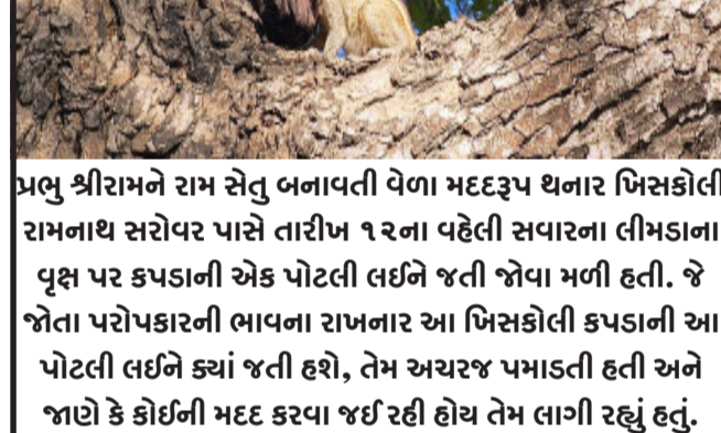
પ્રભુ શ્રીરામને રામ સેતુ બનાવતી વેળા મદદરૂપ થનાર ખિસકોલી રામનાથ સરોવર પાસે તારીખ ૧૨ના વહેલી સવારના લીમડાના વૃક્ષ પર કપડાની એક પોટલી લઈને જતી જોવા મળી હતી. જે જોતા પરોપકારની ભાવના રાખનાર આ ખિસકોલી કપડાની આ પોટલી લઈને ક્યાં જતી હશે, તેમ અચરજ પમાડતી હતી અને જાણે કે કોઈની મદદ કરવા જઈ રહી હોય તેમ લાગી રહ્યું હતું.