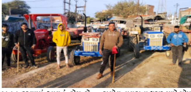
ખનન કરવામાં આવતું હોય છે. ગોમા નદી માંથી થતી ગેરકાયદેસર રેતી ખનનને રોકવા માટે સ્થાનિક તંત્ર અને જી.એસ.ટી. તંત્ર દ્વારા અનેકવખત રેઈડ કરી કાર્યવાહી કરવામાં આવી છે. તેમ છતાં ખનિજ માફિયાઓ દ્વારા રેતી ખનન કરવામાં આવી રહ્યું છે.

કાલોલ, કાલોલ તાલુકાના ઘુસર ગામે ગોમા નદીના પટ માંથી ગેરકાયદેસર રેતીનું ખનન કરાઈ રહ્યું છે. તેવી બાતમીના આધારે જી.એસ.ટી.વિભાગની ટીમ દ્વારા દરોડો પાડવામાં આવ્યો હતો. ખાણ ખનિજ વિભાગની કાર્યવાહી દરમિયાન રેતી ખનન કરતાં પાંચ ટ્રેક્ટરો મળી ૨૫ લાખનો મુદ્દામાલ ઝડપી પાડવામાં આવ્યો છે.