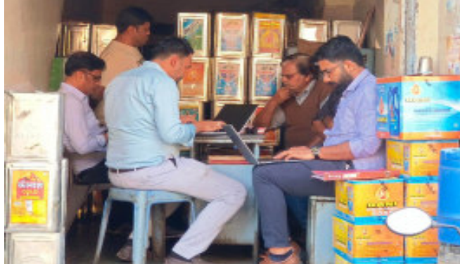
ફક્કાટ વ્યાપી જવા પામ્યો છે. ગોધરામાં વડોદરા થી આવેલ જી.એસ.ટી. વિભાગના અધિકારીઓની ટીમ દ્વારા સ્ટેશન રોડ ચોકી નંબર-૬ પાસે આવેલ ભરત મહેતા ટ્રેડર્સ નામના જથ્થા બંધ તેલની વેપારી પેઢી ઉપર સર્ચ કાર્યવાહી હાથ ધરવામાં આવી છે. તેલની વેપારી પેઢીમાં કરચોરીની આશંકા સાથે જી.એસ.ટી. દ્વારા

ગોધરા, ગોધરા શહેરના સ્ટેશન રોડ વિસ્તારમાં આજે સવારથી જી.એસ.ટી.વિભાગ વડોદરાની ટીમ દ્વારા તેલ વેપારી પેઢી ઉપર સર્ચ કાર્યવાહી હાથ ધરવામાં આવી છે. કરચોરીની આશંકાના આધારે આ સર્ચ કાર્યવાહી હાથ ધરાઈ છે. જી.એસ.ટી. વિભાગની ટીમ દ્વારા વેપારી પેઢીના તમામ વ્યાવસાયિક દસ્તાવેજો, બિલ બુક, સ્ટોક રજીસ્ટર તેમજ અન્ય આનુસંગિક કાગળોની તપાસ હાથ ધરવામાં આવી છે. સ્ટેશન રોડ ઉપર તેલ વેપારી પેઢી ઉપર જી.એસ.ટી.ની કાર્યવાહીને લઈ અન્ય વેપારીઓમાં