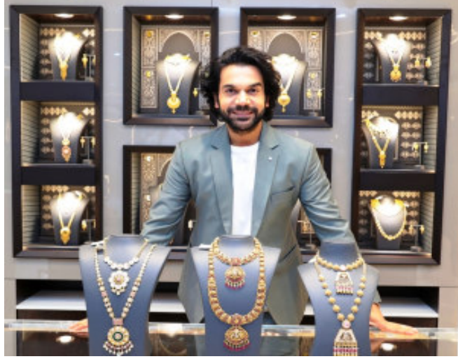
ઉત્સાહી લોકોને સંબોધતા બોલિવૂડ સ્ટાર રાજકુમાર રાવે જણાવ્યું હતું કે “કલ્યાણ જવેલર્સના નવા શોરૂમના ઉદઘાટન માટે આજે અહીં ઉપસ્થિત રહેતા મને આનંદ થાય છે. કલ્યાણ જવેલર્સનું પ્રતિનિધિત્વ કરવું એ ગૌરવની વાત છે. આ એક એવી બ્રાન્ડ છે જે વિશ્વાસ, પારદર્શિતા અને ગ્રાહક-કેન્દ્રિતતાના સિદ્ધાંતો પર મજબૂત રહે છે. મને વિશ્વાસ છે કે માનવંતા ગ્રાહકો કલ્યાણ જવેલર્સને ઉમંગભરે વધાવી લેશે. સર્વિસ આધારિત શોપિંગનો અનુભવ પ્રાપ્ત કરશે. શોરૂમ ખાતે ઉપસ્થિત

ગોધરા, ભારતની સૌથી મોટી અને સૌથી વિશ્વવિખ્યાત જવેલરી બ્રાન્ડ્સ પૈકીની એક કલ્યાણ જવેલર્સ ગોધરામાં તેના બ્રાન્ડ ન્યુ શોરૂમને આજે લોન્ચ કર્યો હતો. જે શહેરમાં કંપનીનો પ્રવેશ દર્શાવે છે. બોલિવૂડ સ્ટાર રાજકુમાર રાવે શોરૂમનું ઉદઘાટન કર્યું હતું. જેમાં કલ્યાણ જવેલર્સના વિવિધ કલેક્શનની વ્યાપક રેન્જની ડિસ્પ્લે છે. આ કાર્યક્રમમાં લોકો, યાહકો અને ગ્રાહકો સુપરસ્ટારની એક ઝલક જોવા માટે મોટી સંખ્યામાં ઉમટી પડ્યા હતા. ઉષ્માભર્યા સ્વાગતથી લોન્ચમાં એક જીવંત ઉર્જાનો ઉમેરો થયો. જે આ નવા શોરૂમના ઉદઘાટન અંગે લોકોનો ઉત્સાહ અને અપેક્ષાને પ્રતિબિંબિત કરે છે.