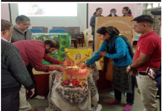
ઝાલોદ, શ્રી કે.આર. દેસાઈ આર્ટ્સ એન્ડ કોમર્સ કોલેજ ઝાલોદમાં વસંતપંચમી નિમિત્તે વસંતોત્સવ કાર્યક્રમનું આયોજન કરવામાં આવ્યું.