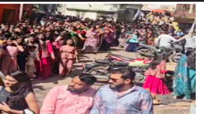
જ્ઞાનની દેવી માં સરસ્વતીજી સાથે કામના દેવીની પણ આરાધના થાય છે. શુભ દિવસ છે આખો દિવસ સારા મુરતો રહેવાથી લગ્ન સહિત અનેક શુભ કાર્યો યોજાય છે.

દાહોદ, મહાસુદ પંચમ એટલે વસંત પંચમી અને વસંત પંચમી એટલે ત્રમુઓના રાજા વસંતનો પ્રારંભ. હિંદુ વર્ષના ૧૨ મહિનામાં આવતા કેટલાક શુભ દિવસોમાં શ્રેષ્ઠ શુભ દિવસ તરીકે વસંત પંચમીનો ઉત્સવ ગણાય છે. આ દિવસે શુભ કાર્ય કરવા કોઈ મોહરત કાઢવાની જરૂર ન હોય દાહોદ શહેર સહિત જીલ્લામાં માંગલિક પ્રસંગો અને લગ્ન ઉત્સવનો માહોલ સર્જાવવા પામ્યો હતો. જ્યારે દાહોદમાં ડબગર સમાજ દ્વારા ભવ્ય શોભાયાત્રા કાઢવામાં આવી હતી.