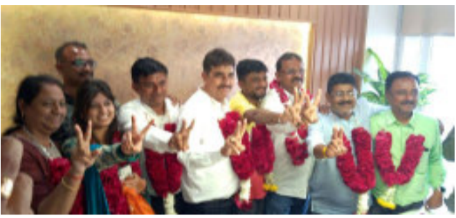
ચકાસણી કરવામાં આવી હતી ત્યારે ઉમેદવારી પત્રોની ચકાસણી દરમિયાન વોર્ડ નંબર ચાર અને બે એનસીપીના પાંચ ઉમેદવારોના ફોર્મ રદ થયા હતા. પરિણામે વોર્ડ નંબર ૪ ના ભાજપની પેનલ બિનહરીફ જીતી હતી. ચૂંટણી પહેલા જ

બાલાસિનોર, બાલાસિનોર નગરપાલિકાની ચૂંટણી ઉમેદવારી પત્રો ભરાયા હતા તે ઉમેદવારી પત્રો સોમવારે ચકાસણી સમયે વોર્ડ નંબર બે અને ચાર એનસીપીના પાંચ ઉમેદવારોના મેન્ડેટ્સ રદ ગણાતો ઈમેલ ચૂંટણી અધિકારીને મળતા બાલાસિનોર રાજકારણમાં ભારે ગરમાવો આવી ગયો હતો. જ્યારે વોર્ડ -૪ ના ભાજપના ઉમેદવારો બિનહરીફ થયા હતા.