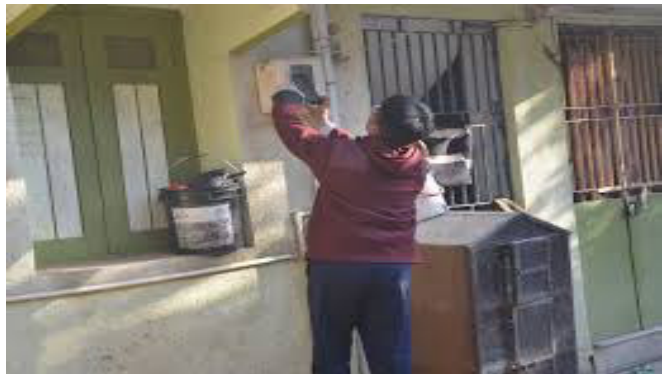
ઉર્જા વિકાસ નિગમ લીમિટેડ અને પંચમહાલ પોલીસની ટીમ સાથે રાખીને મેગા સર્ચ કામગીરી હાથ ધરવામાં આવી હતી. પશ્ચિમ વિસ્તારના પોલનબજાર, વેજલપુર રોડ, સાતપુલ, સ્ટેશન રોડ,

ગોધરા, ગોધરા શહેરના પશ્ચિમ વિસ્તારમાં આજરોજ મધ્ય ગુજરાત વીજ કંપની અને પોલીસ વિભાગને સાથે રાખીને વીજ કનેક્શનનું ચેકીંગ હાથ ધરવામાં આવ્યું હતું. વીજ કંપનીના મેગા સર્ચ અભિયાનમાં ૬૧ ટીમોના ૨૪૪ કર્મચારીઓ ૭૭ પોલીસ કર્મચારીઓ જોડાયા હતા. પશ્ચિમ વિસ્તારમાં ૧૩૫૬ વીજ કનેક્શન ચેકીંગમાં ૭૩ ગ્રાહકો પાસેથી ૩૦ લાખ રૂપિયાની વીજ ચોરી ઝડપાઈ પાડવામાં આવી છે.