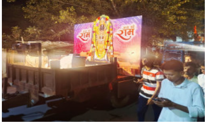
જાન્યુઆરીના રોજ એક વર્ષ ભગવાન રામલલાની અયોધ્યામાં બિરાજમાન

ગોધરા, અયોધ્યા રામ મંદિરમાં રામલલાની મૂર્તિ પ્રાણ પ્રતિષ્ઠાને ૨૨ જાન્યુઆરીના રોજ એક વર્ષ પૂર્ણ થયું છે. અયોધ્યામાં રામલલાના બિરાજમાનને વર્ષને ગોધરા નગરમાં વધામણી કરવામાં આવી હતી.