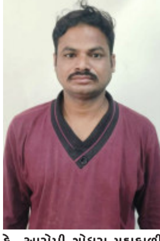
કે, આરોપી ગોધરા મહાકાળી મંદિર ખાતે હોય તેવી બાતમીના આધારે ૪૬૫૧ પાડવામાં આવ્યો હતો અને આરોપીને રાજપીપલા પોલીસને સોંપવામાં આવ્યો છે.

ગોધરા, પંચમહાલ જીલ્લા પેરોલ ઇલો સ્કોર્ડને બાતમી હતી કે, રાજપીપલા પોલીસ મથકના ગુનામાં નાસતા ફરતા વોન્ટેડ આરોપી ગોધરા ખાતે હોવાની બાતમી મળી હતી. બાતમીના આધારે આરોપીને ૪૬૫૧ પાડવામાં આવ્યો છે.