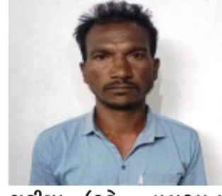
ભુરીયા (રહે. ઝાબુઆના નેગડીયા) અંગે પંચમહાલ એસ.ઓ.જી. પોલીસને બાતમી મળી હતી કે, આરોપી સંતરામપુર પોલીસ મથકમાં પાસેથી ૪૬૫૧ પાડીને મોરવા(હ) પોલીસ મથકને સોંપવામાં આવ્યો છે.

ગોધરા, પંચમહાલ એસ.ઓ.જી. પોલીસને મળેલ બાતમીના આધારે મોરવા(હ) અને સંતરામપુર પોલીસ મથકના ઘાડા લુંટના ગુનામાં છેલ્લા ૧૯ વર્ષથી નાસતા ફરતા વોન્ટેડ આરોપીને સંતરામપુર પોલીસ મથકમાં પાસેથી ૪૬૫૧ પાડવામાં આવ્યો.