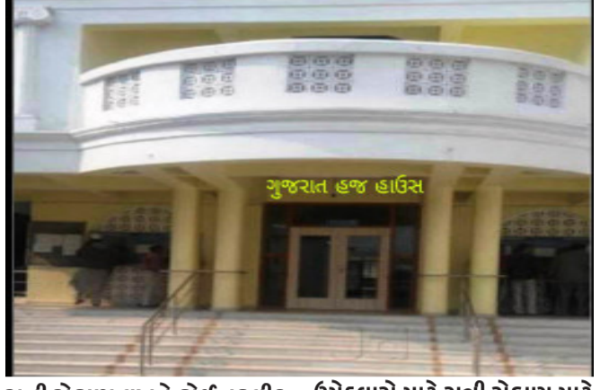
રાત્રી રોકાણ વખતે કોઈ તકલીફ ના પકે તેને દયાને લઈ ગુજરાત રાજ્ય હજ કમિટી દ્વારા મહીલા