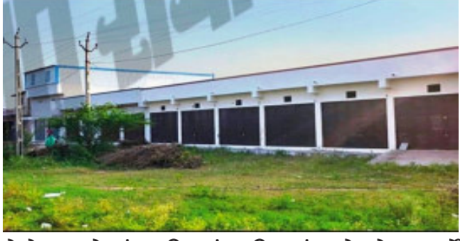
દાહોદ, દાહોદમાં અહુચર્ચિત નક્લી N A પ્રકરણ સામે આવ્યા બાદ અત્યારે તંત્ર દ્વારા જમીન કૌભાંડમાં હકીકતલક્ષી અહેવાલ મેળવવા માટે રિઝર્વની કામગીરી ચાલી રહી છે દરમિયાન એ જયકુદેટીવ મેજિસ્ટ્રેટ અને મામલતદાર દાહોદએ કોર્ટ દ્વારા સાંગા ફળિયામાં સરકારી જમીનમાં કરવામાં આવેલા પાકા બાંધકામો ૧૫ દિવસમાં દૂર કરવા માટે પટ થી વધુ મિલકત ધારકોને નોટિસો ફટકારવામાં આવી છે. જેના પગલે સાંગા ફળિયામાં મિલકતો વેચાતી લેનાર મિલકત ધારકોના પુનઃએક વખત જીવ પડીકે બંધાઈ ગયા છે.

દાહોદ કસબાના સાંગા ફળિયામાં આવેલ રેવન્યુ સર્વે નંબર ૧૦૦૩ સરકારી પડતર અને રસ્તા પૈકીની જમીન હોવાનું ફલિત થયા પામ્યું છે. સરકારી જમીન ઉપર ઉભા કરવામાં આવેલા પાકી દુકાનો ગોડાઉન વિગેરે બાંધકામને સ્વખર્ચે દૂર કરવા જમીન મહેસુલ કાયદાની કલમ ૬૧ હેઠળ દબાણદારોને સ્વખર્ચે દબાણ દૂર કરવા નોટિસ આપવામાં આવી હતી. તંત્ર દ્વારા અપાયેલી નોટિસ બાદ સાંગા ફળિયાના મિલકત ધારકોમાં આકોશ સાથે ગમગીની ફેલાઈ જવા પામી હતી. એટલું જ નહીં વર્ષોની મૂડી હોમાઈ જશે ની બીકે ઉપરોક્ત સર્વે નંબરમાં આવેલ પટ થી વધુ મિલકત ધારકો દ્વારા પોતે જ માલિક છે. તેમની પાસે સરકારી દસ્તાવેજો તેમજ અન્ય સરકારી ડોક્યુમેન્ટ થયા છે તેવી રજૂઆત સાથે કલેક્ટર એસ.ડી.એમ વિગેરે સમક્ષ રાવ કરી હતી અને આવેદનપત્રો પણ અપાયા હતા. પરંતુ નક્લી N A પ્રકરણમાં તપાસ દરમિયાન સરકારી જમીન ઉપર દબાણ હોવાનું કૌભાંડ બહાર આવવા પામ્યું હતું. દાહોદ ગામની સર્વે નંબર ૧૦૦૩ ની સદર જમીન ઈજનેર ખાતાને મોરમ માટેની/ સરકારી પડતર અને રસ્તા પૈકીની જમીન હોવાનું બહાર આવ્યું હતું. ત્યારબાદ હાઈકોર્ટના ડાયરેક્શન મુજબ હાઈકોર્ટ ની