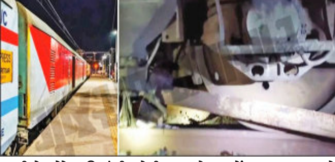
આવી છે. જોકે અતિ ગંભીર એવી બાબત હાલ સુધી કેમ ઢંકાયેલી રહી છે. ? તે પણ તપાસનો વિષય છે. પ્રાપ્ત માહિતી અનુસાર પશ્ચિમ રેલવેના વડોદરા મંડળમાં આવેલા ગોધરા ચાર્ડમાં ફિલોમીટર નંબર ૪૭૦/૩૨-૩૪ પાસે બાંદ્રા થી અમૃતસર તરફ જતી ૧૨૯૨૫ પશ્ચિમ એક્સપ્રેસ અત્રેથી પસાર થઈ રહી હતી તે સમયે એન્જિનના ઘાબા પૈડામાં લોખંડનો પોલ ફસાયો હોવાનું ફટ પેટ્રોલિંગમાં નીકળેલા આરપીએફ ને જાણ થતા આરપીએફની ટીમ ઘટના સ્થળે પહોંચી હતી અને ગોધરા એડવાન્સ સિગ્નલ પાસે ડાઉન ટ્રેક પર ચાર પાંચ મીટરનો ઇલેક્ટ્રીક પોલ મથકમાં મુક્યો તેવી સમચની માંગ છે ત્યારે સંબંધીતો દ્વારા આ ફક્ત એક અકસ્માત હોવાનું રટણ કરી રહ્યા છે. એટલું જ નહીં ગોધરા મંડળમાં ભંગાર ચોરીની શક્યતાને ધ્યાને લઈ હાલ જીઆરપી પોલીસ દ્વારા તે દિશામાં તપાસ હાથ ધરવામાં આવી છે.