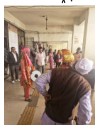
મહિસાગરની એ.આર.ટી.ઓ. શાખા દ્વારા રોડ સેફ્ટી માસ અંતર્ગત ટ્રાફિક નિયમોનું મલ્ટિ લોકો સુધી પહોંચાડી તેમને જાગૃત કરવાનો પ્રયાસ કરી રહી છે. જેથી ભવિષ્યમાં અકસ્માતની ઘટનાઓને અટકાવી શકાય અને લોકોનો જીવ બચી શકે. માર્ગ સલામતી માસ અંતર્ગત આજરોજ એઆરટીઓ લુણાવાડા દ્વારા એસટી ડેપો લુણાવાડા ખાતે શેરી નાટક ભજવી લોકોમાં ગમ્મત સાથે ટ્રાફિક ના નિયમો અંગે માર્ગદર્શન આપી લોકોને ટ્રાફિકના નિયમો બાબતે ઉડાણપૂર્વક સમજ આપી હતી. હેલમેટ અને સીટ બેલ્ટની ઉપયોગીતાની સમજ આપવામાં આવી હતી.