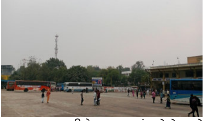
બાલાસિનોર, વાતાવરણમાં પલટો જોવા મળ્યો મહિસાગર જીલ્લાના હોતો. બાલાસિનોર તાલુકાઓ બાલાસિનોરમાં બે દિવસથી સહિત આસપાસના વિસ્તારોમાં બે

બાલાસિનોર સવારથી વાતાવરણમાં ઘુમ્મસ છવાયેલું રહ્યું હતું. જેના કારણે વિઝિબિલિટી નહીંવત થઈ જતાં દૂર ના દ્રશ્ય ઝાંખા જણાતા હતા. ઘુમ્મસ બાદ દિવસ દરમિયાન આકાશમાં આછા વાદળ હોવાથી સૂર્ય પ્રકાશની ગેરહાજરી વર્તાતી હતી.