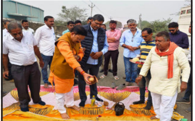
નડિયાદ, ખેડાના હરિયાળા નજીક વડાલા પાટિયાથી નેશનલ હાઇવે સુધીનો ૩૫૦૦ મીટર રોડનું રૂ.૩.૮૦ કરોડના ખર્ચે નિર્માણ થશે. આ રોડનું કામ પૂર્વ કેન્દ્રીય મંત્રી અને ખેડાના સાંસદ ટેવુસિંહ ચૌહાણ, ધારાસભ્ય કલ્પેશભાઈ પરમારની ઉપસ્થિતિમાં શરૂ કરવામાં આવ્યું હતું.

રોડના કાર્યારંભે યોજાયેલા સમારંભમાં સાંસદ ટેવુસિંહ ચૌહાણ દ્વારા જણાવવામાં આવ્યું કે, આંતર માળખાકીય સવલતમાં રોડના કામને પ્રાથમિકતા આપવાનો અભિમત કેન્દ્ર અને રાજ્ય બંનેનો છે. માટે રોડ-રસ્તાના કામ માટે નાણાકીય નોંધણી પૂરતી થાય તે હિશામાં પ્રયત્ન કરવો જોઈએ. રસ્તાના બાંધકામ દરમિયાન જનતાએ પણ તેની ગુણવત્તા બાબતે જાગૃત રહેવું જોઈએ. જેથી રોડ બની ગયા પછી ઉત્કૃષ્ટ લોકરિયાઇને અવકાશ ના રહે. વધુમાં સાંસદ દ્વારા જણાવવામાં આવ્યું કે, સંબંધિત અધિકારી અને એજન્સીઓએ પણ સમર્પિત ભાવથી ગુણવત્તા સભર કામ થાય તેનું ધ્યાન રાખવું જોઈએ. આ કાર્યક્રમમાં ખેડા જીલ્લા પંચાયત સભ્ય દોલતસિંહ પરમાર, વડાલના સરપંચ ગાજેન્દ્રસિંહ ઝાલા, અજીતસિંહ, પ્રવિણસિંહ સહિત મોટી સંખ્યામાં ગ્રામજનો ઉપસ્થિત રહ્યા હતા.