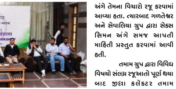
વિષયો ઉપર વિગતવાર ચર્ચા કરવામાં આવી હતી. ખેડા, માતર, મહેમદાવાદ અને વસોના ગ્રુપ દ્વારા પશુઓમાં થતા રોગો અને તેના નિદાન માટે જીલ્લા અને તાલુકા કક્ષાએ શું સુધારા લાવી શકાય તે અંગે રજૂઆત કરવામાં આવી હતી. ત્યારબાદ કપડવંજ અને કલલાલના ગ્રુપ દ્વારા દૂધ ઉત્પાદન વધારવા અંગે અને ઘાસચારાની સમસ્યા નું સમાધાન કેવી રીતે લાવી શકાય તે અંગે વિચારો રજૂ કરવામાં આવ્યા હતા.

નડિયાદ, જીલ્લા કલેક્ટર અમિત પ્રકાશ યાદવના અધ્યક્ષ સ્થાને સ્વામિનારાયણ ગુરૂકુળ, નડિયાદ ખાતે સુશાસન સપ્તાહની ઉજવણીના ભાગ રૂપે પશુપાલન ક્ષેત્રે માળખાકીય સવલતોમાં સુધારો લાવવા માટે ચિંતન શિબિરનું આયોજન કરવામાં આવ્યું હતું. આ ચિંતન શિબિરમાં વેટનરી ઓફિસર્સ, ડોક્ટર્સ, ખેડૂતો અને પશુપાલકોએ ભાગ લીધો હતો. જીલ્લા કલેક્ટર દ્વારા ઉપસ્થિત તમામને પશુપાલન ક્ષેત્રે રોજિંદી કામગીરીમાં નડતરરૂપ બનતા પ્રશ્નો અંગે ખાસ રજૂઆત કરવા માટે અનુરોધ કરવામાં આવ્યો હતો. આ ઉપરાંત ઉપસ્થિત તમામ વહીવટી તંત્રના અધિકારીઓ ખેડૂતો અને પશુપાલકોને ગુપ્તમાં વહેંચીને પશુપાલન ક્ષેત્ર સંલગ્ન વિવિધ