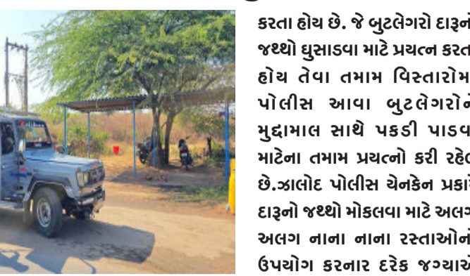
કરતા હોય છે. જે બુટલેગરો દારૂનો જથ્થો ઘુસાડવા માટે પ્રયત્ન કરતા હોય તેવા તમામ વિસ્તારોમાં પોલીસ આવા બુટલેગરોને મુદ્દામાલ સાથે પકડી પાડવા માટેના તમામ પ્રયત્નો કરી રહેલ છે. ઝાલોદ પોલીસ ચેનકેન પ્રકારે દારૂનો જથ્થો મોકલવા માટે અલગ અલગ નાના નાના રસ્તાઓનો ઉપયોગ કરનાર દરેક જગ્યાએ નાકાબંધી કરી રહેલ છે અને પોલીસ દ્વારા ગાંધીના ગુજરાતમાં દારૂ ન આવે તેવા તમામ પ્રયત્નો કરી રહેલ છે. ઝાલોદ પોલીસ અવારનવાર નગરમાં તેમજ હવે ચેક પોસ્ટો પર પણ ડ્રોન કેમેરાનો ઉપયોગ કરી અસામાજિક પ્રવૃત્તિ કરનારા લોકો પર નજર રાખી રહેલ છે.