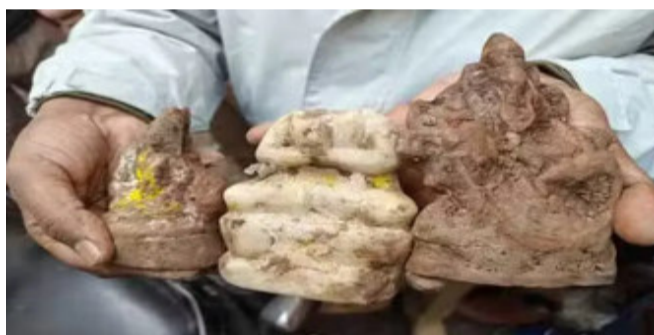
આ પ્રતિમાઓની કાર્બન ડેટિંગ કરવામાં આવશે. અહીં આરસની બનેલી પ્રતિમા પણ છે, જે કાર્તિકેયજીની હોય તેવું લાગે છે. ૨ પ્રતિમાઓ ખોદિત છે.

સંભલ, હાલમાં જ પ્રશાસને ઉત્તર પ્રદેશના સંભલમાં જૂના શિવ મંદિરને ખોલ્યું છે, જે ૪૬ વર્ષથી બંધ હતું. આ મંદિરમાં પ્રાચીન શિવલિંગની સાથે હનુમાનજીની મૂર્તિ અને કૂવો પણ મળી આવ્યો છે. હવે વહીવટીતંત્રને કૂવો ખોદતી વખતે તે મૂર્તિઓ મળી આવી છે. આ મૂર્તિઓ માતા પાર્વતી, ગણેશ અને કાર્તિકેયની છે. આ મંદિર ૧૯૦૮થી બંધ હતું. વહીવટી તંત્રે આ મંદિરને સાફ કરાવ્યું અને ૧૫ ડિસેમ્બરે આ મંદિરમાં ધાર્મિક વિધિ અને મંત્રોના જાપ સાથે પૂજા આરતી કરવામાં આવી.