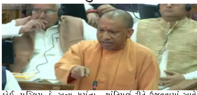
કોઈ મુસ્લિમ કે અન્ય ધર્મના તહેવારોમાં કોઈ સમસ્યા ન હોય તો હિન્દુઓના તહેવારોમાં કોઈ સમસ્યા નથી. જો તે ઉભી કરવામાં આવશે તો સરકાર તેની સાથે કડક કાર્યવાહી કરશે.

ભગવાન વિષ્ણુનો દસમો અવતાર સંભલમાં જ થશે.કોર્ટના આદેશ પર સંભલમાં સર્વે કરવામાં આવી રહ્યો છે