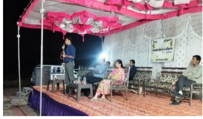
મહિસાગર જિલ્લાના બાલાસિનોર તાલુકાના આલેલા ગામ ખાતે પ્રાંત અધિકારીશ્રીના અધ્યક્ષ સ્થાને રાત્રી સભા યોજાઈ