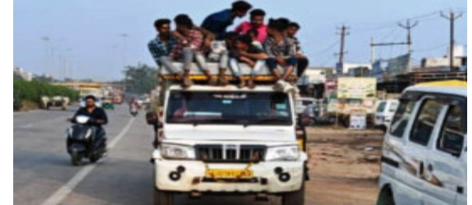
સાંજના પાંચેક વાગ્યાના સુમારે પાઈ શોરૂમની સામે રોડ પરથી પસાર થઈ રહેલી ઘેટા બકરાની જેમ ગેરકાયદેસર રીતે ખીચોખીચ પેસેન્જર ભરેલ પીકપ ગાડીને ફરજ પરના જિલ્લા ટ્રાફિક પોલીસ જવાનોએ રોકી હતી અને ટ્રાફિકના નિયમોનું ધારા ઉલ્લંઘન કરી ઘેટાબકરાની જેમ પીકપ ગાડીમાં ગેરકાયદેસર રીતે ખીચોખીચ પેસેન્જરો ભરવા સબબ મેમો આપતા