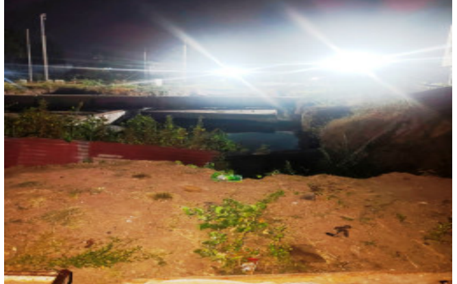
મોટાભાગે ટ્રેનોની અવર-જવરને લઈ બંધ રહેતી હોય જેને લઈ નગરજનોની રેલ્વે ફાટરની સમસ્યાના હલ માટે લાંબા સમયથી રજુઆતો બાદ શહેરા ભાગોળ રેલ્વે ફાટકના સ્થાને રેલ્વે અન્ડર બ્રીજની કામગીરી શરૂ કરવામાં આવી હતી. શહેરા ભાગોળ છેલ્લા એક વર્ષથી અન્ડર બ્રીજની કામગીરી હાથ ધરવામાં આવી છે. અન્ડર બ્રીજની કામગીરી મંથરગતિથી કરાઈ રહી