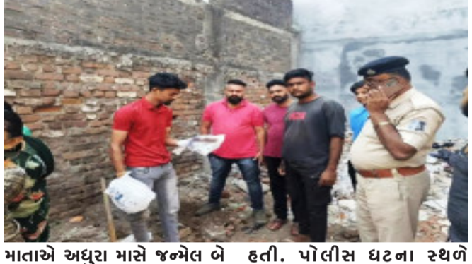
પ્લોટમાં કોઈ નિર્દયી માતા દ્વારા બે જોડીયા નવજાતને વહેલી સવારે ખુદામાં ફેંકી ચાલી ગઈ હતી. ખુદા કોમન પ્લોટમાં નવજાત શીશુઓને ફેંકી ગયાની ઘટનાની તપાસ માટે નજીકની લેબોરેટરી આગળ લાગેલા સીસી ટીવી ચેક કરવામાં આવ્યા. તેમાં જણાઈ આવ્યું હતું. અધુરા માસે જન્મેલ બે જોડીયા નવજાતને ખુદા કોમન પ્લોટમાં ફેંકી દેવાની ઘટનાને લઈ સ્થાનિક રહિશોમાં ભારે રોષ જોવા મળ્યો અને નિષ્ક્રમ માતા સામે ફિટકાર વરસાવતા જોવા મળ્યા હતા.

ગોધરા, ગોધરા શહેર ભુરાવાવ ડબગરવાસ વિસ્તારની ખુદી જગ્યામાં અધુરા માસે જન્મેલ બે નવજાત બાળકોને ફેંકી ગયાની ઘટનાથી ચક્રાચર મચી જવા પામી હતી. આ વિસ્તારના સ્થાનિક દ્વારા પોલીસને જાણ કરવામાં આવતાં પોલીસ ઘટના સ્થળે પહોંચી ફેંકી દેવામાં આવેલ નવજાતનો કબ્જો મેળવી તપાસ કાર્યવાહી હાથ ધરવામાં આવી છે. ગોધરાના ભુરાવાવ વિસ્તારના ડબગરવાસ ખાતે કોમન પ્લોટમાં કોઈ નિર્દયી પ્લોટમાં કોઈ નિર્દયી માતા દ્વારા બે જોડીયા નવજાતને વહેલી સવારે ખુદામાં ફેંકી ચાલી ગઈ હતી. ખુદા કોમન પ્લોટમાં નવજાત શીશુઓને ફેંકી ગયાની ઘટનાની તપાસ માટે નજીકની લેબોરેટરી આગળ લાગેલા સીસી ટીવી ચેક કરવામાં આવ્યા. તેમાં જણાઈ આવ્યું હતું. અધુરા માસે જન્મેલ બે જોડીયા નવજાતને ખુદા કોમન પ્લોટમાં ફેંકી દેવાની ઘટનાને લઈ સ્થાનિક રહિશોમાં ભારે રોષ જોવા મળ્યો અને નિષ્ક્રમ માતા સામે ફિટકાર વરસાવતા જોવા મળ્યા હતા. પોલીસ ઘટના સ્થળે પહોંચીને નવજાતનો કબ્જો મેળવ્યો હતો અને નવજાતને કોણ ફેંકી ગયું તે દિશામાં તપાસ હાથ ધરી છે. ગોધરા ડબગરવાસમાં ખુદા કોમન