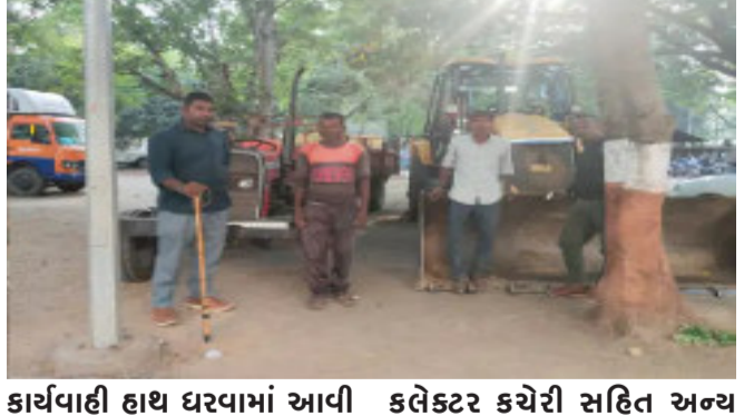
કલેક્ટર કચેરી સહિત અન્ય સ્થળે

ફરી એક વખત પંચમહાલ જિલ્લાની ખાણ ખનીજ વિભાગની સોથી મોટી કાર્યવાહી સામે આવી છે. જેમાં જિલ્લામાં એક અઠવાડિયામાં પંચમહાલ જિલ્લાના ગોધરા તાલુકાના કાકણપુર તેમજ શહેરા તાલુકાના બાહી ગામે અને કાલોલ તાલુકાના છગનપુર ગામે ગેરકાયદેસર રેતી, બ્લેક ટ્રેપ માટી સહિતની હેરાફેરી કરતા એક હિટાચી મશીન, જેસીબી મશીન, બે ટ્રક અને એક ટ્રેક્ટરને ઝડપી પાડી કાયદેસરની કાર્યવાહી હાથ ધરવામાં આવી છે. જ્યારે પકડાયેલા મુદ્દામાલને ગોધરા કલેક્ટર કચેરી સહિત અન્ય સ્થળ ખાતે સીઝ કરીને મૂકવામાં આવ્યો છે. જેના કારણે ખનીજ માફિયાઓમાં ફફડાટ વ્યાપી જવા પામ્યો છે. પંચમહાલ જિલ્લાની ખાણ ખનીજ વિભાગની ટીમે છેલ્લા એક અઠવાડિયામાં ગોધરા તાલુકાના કાકણપુર તેમજ શહેરા તાલુકાના બાહી અને કાલોલ તાલુકાના છગનપુર ગામે ગેરકાયદેસર રીતે રેતી બ્લેક ટ્રેપ અને માટીની હેરાફેરી કરતા એક હિટાચી મશીન એક ટ્રેક્ટર સહિતનો મુદ્દામાલ કબજે કરી કાયદેસરની કાર્યવાહી હાથ ધરવામાં આવી હતી. જ્યારે પકડાયેલા મુદ્દામાલને ગોધરા સ્થળ ઉપર સીઝ કરીને મૂકવામાં આવ્યો હતો. પંચમહાલ જિલ્લાની ખાણ ખનીજ વિભાગની ટીમે દોઢ કરોડ જેટલો મુદ્દામાલ કબજે કરી અને ચાર ઈસમો સામે ઈંડનીય કાર્યવાહી હાથ ધરવામાં આવતા કેટલાક ખનીજ માફિયાઓમાં ફફડાટ વ્યાપી જવા પામ્યો હતો.