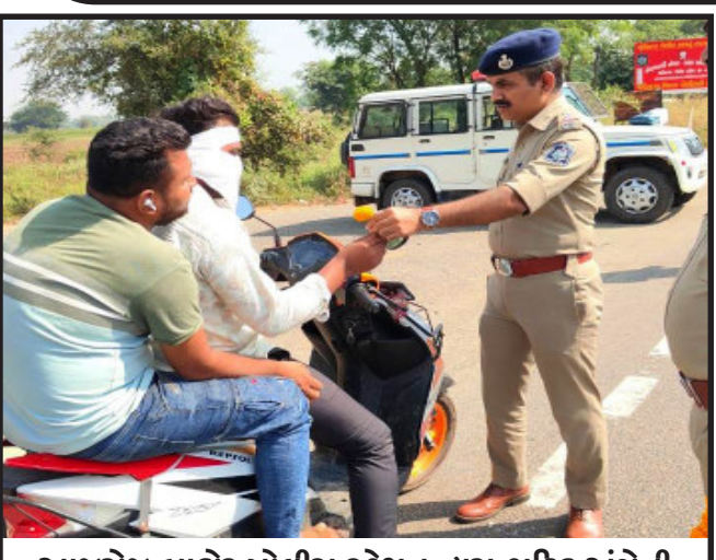
આજરોજ બાકોર પોલીસ સ્ટેશન દ્વારા ટ્રાફિક અંગેની જાગૃતતા લાવવા માટે અને અકસ્માતોની સંખ્યા ઘટાડે એ માટે “ટ્રાફિકના નિયમોનું પાલન કરીએ, પોતાની તેમજ અન્યોની જિંદગી બચાવીએ”ની થીમ હેઠળ માર્ગ સુરક્ષા માટેના સોનેરી નિયમોના પેમ્પ્લેટની વહેંચણી કરી તથા ફૂલ આપી જાગૃતિ અભિયાન ચલાવવામાં આવેલ છે.

જમ્મુ કાશ્મીરના લેફ્ટનન્ટ ગવર્નર મનોજ સિંહાએ મંગળવારે ચેતવણી આપી હતી કે જે લોકો આતંકવાદીઓને આશ્રય આપે છે તેમના ઘરનો નાશ કરવામાં આવશે. તેમણે લોકોને આતંકવાદીઓ સામે ઉભા થવાનું આહ્વાન કર્યું અને કહ્યું કે જે સુરક્ષા દળો, કેન્દ્રશાસિત પ્રદેશ પ્રશાસન અને લોકો સાથે મળીને કામ કરે તો એક વર્ષમાં આ વિસ્તારમાંથી આતંકવાદને ખતમ કરી શકાય છે. બારામુલ્લા જિલ્લામાં એક કાર્યક્રમ દરમિયાન લેફ્ટનન્ટ ગવર્નર સિંહાએ કહ્યું કે, મેં દળોને નિર્દોષોને નુકસાન ન પહોંચાડવાનો નિર્દેશ આપ્યો છે, પરંતુ ગુનેગારોને કોઈપણ સંજોગોમાં બક્ષવામાં આવશે નહીં. જો કોઈ આતંકવાદીઓને આશ્રય આપશે તો તેનું ઘર બરબાદ કરી દેવામાં આવશે. આ અંગે કોઈ બાંધછોડ કરવામાં આવશે નહીં. તેમણે કહ્યું કે કેટલાક લોકો એવા નિવેદનો આપે છે કે જેઓ આતંકવાદીઓને આશ્રય આપે છે તેમના પર અત્યાચાર કરવામાં આવે છે, પરંતુ આ ત્રાસ નથી, પરંતુ ન્યાયની માંગ છે અને આ ન્યાય ચાલુ રહેશે. સિંહાએ કહ્યું કે કેટલાક