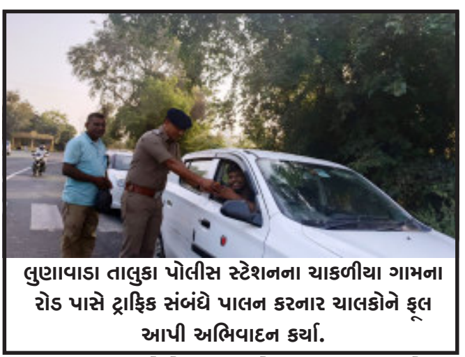
લુણાવાડા તાલુકા પોલીસ સ્ટેશનના ચાકળીયા ગામના રોડ પાસે ટ્રાફિક સંબંધે પાલન કરનાર ચાલકોને ફૂલ આપી અભિવાદન કર્યાં.