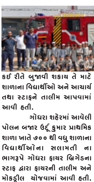
જેમાં શાળાઓમાં અભ્યાસ કરતા વિદ્યાર્થીઓ આપણા દેશના ભાવી ઘડવૈયા છે, જેથી તેની સુરક્ષાની જવાબદારીના ભાગરૂપે ગોધરા શહેરમાં આવેલ પોલન બજાર ઉર્દુ કુમાર પ્રાથમિક શાળા ખાતે ૭૦૦ થી વધુ શાળાના વિદ્યાર્થીઓના સલામતી ના ભાગરૂપે ગોધરા ફાયર બ્રિગેડના સ્ટાફ દ્વારા ફાયરની તાલીમ અને મોકડૂલ યોજવામાં આવી હતી.

ગોધરા, ગોધરા શહેરમાં આવેલી પોલન બજાર ઉર્દુ કુમાર પ્રાથમિક શાળા ખાતે શાળા સલામતીના ભાગરૂપે ૭૦૦થી વધુ શાળાના વિદ્યાર્થીઓ અને આચાર્ય તથા સ્ટાફને ગોધરા ફાયર બ્રિગેડ ના સ્ટાફ દ્વારા ફાયર સેફ્ટી ની તાલીમ અને મોકડૂલ યોજવામાં આવી હતી. જેમાં શાળામાં આકસ્મિક રીતે આગ લાગે ત્યારે આગ ઉપર કઈ રીતે કાબુ મેળવવો તે માટે માહિતી પૂરી પાડવામાં આવી હતી. જેમાં ફાયર એકસ્ટીગ્યુઅર બોટલનો ઉપયોગ કઈ રીતે કરવો તે માટે તેનો કેમો બતાવવામાં આવ્યો હતો. અને શાળા સંકુલમાં આગ લાગી હોય ત્યારે તાત્કાલિક આગ