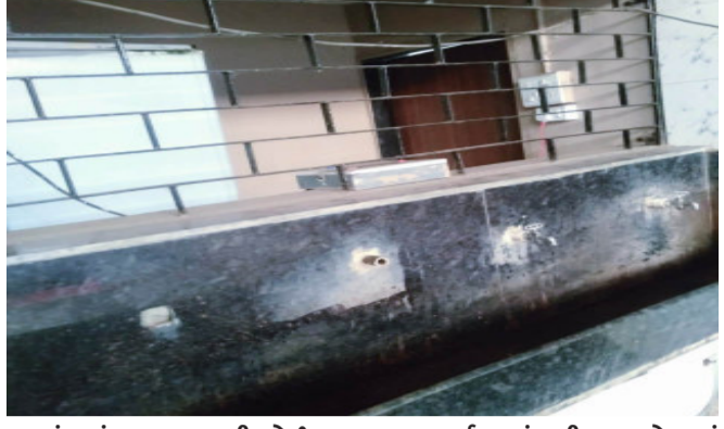
કરાયું હતું. ત્યારબાદથી કોઈપણ એસ.ટી.ના દ્વારા આ પીવાના પાણીના પરબ બંધ કરી જવું સમારકાર્ય કરાયું નથી. બસ સ્ટેન્ડમાં જે એસ.ટી. ડેપોનું પાણીની પરબ પછા હાલ બે-ત્રણ માસ થી મોટર વિકાસ સત્તા ઉજવણી ભાગ રૂપે દે. બારીયા તાલુકાના સેવનીયા પ્રાથમિક આરોગ્ય કેન્દ્ર ખાતે દષ્ટિ નેત્રાલય દાહોદ ના સહયોગથી મેડિકલ કેમ્પ યોજાયો

દે.બારીયા, દે.બારીયા, એસ.ટી.ડેપોમાં લોંગ રૂટની બસોનું અવર જવર છે. હાલમાં દશોરા દિવાળીના મુખ્ય તહેવારોમાં કન્સ્ટ્રક્શનના કામ માટે ગયેલા કારીગરો તેમ બાંધકાર્ય માટેના મજૂર વર્ગ બારીયા બસ સ્ટેન્ડ ઉપર આવે છે પરંતુ તેમની સુવિધા માટે જે બે પીવાના પાણીની પરબો હાલમાં બંધ છે. તેમજ બંને પરબોમાં દે.બારીયાના વતની અને હાલ ગુ.એસ.એ.માં સ્થાઈ દાતાઓના દ્વારા પાણીના પરબોનું બાંધકાર્ય કરાયું હતું. ત્યારબાદથી કોઈપણ એસ.ટી.ના દ્વારા આ પીવાના પાણીના પરબ બંધ કરી જવું સમારકાર્ય કરાયું નથી. બસ સ્ટેન્ડમાં જે એસ.ટી. ડેપોનું પાણીની પરબ પછા હાલ બે-ત્રણ માસ થી મોટર વિકાસ સત્તા ઉજવણી ભાગ રૂપે દે. બારીયા તાલુકાના સેવનીયા પ્રાથમિક આરોગ્ય કેન્દ્ર ખાતે દષ્ટિ નેત્રાલય દાહોદ ના સહયોગથી મેડિકલ કેમ્પ યોજાયો