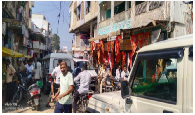
તાલુકાના ગામડાઓમાંથી માલ સામાન ની ખરીદી કરવા આવતા હોય છે. ત્યારે ઓવરલોડ વાહનો આડેઘડ પોતાની મનમરજી મુજબ મુખ્ય રોડ આગળ પાર્ક કરી સામાન ખાલી કરતા હોય છે. જેને કારણે અવારનવાર ટ્રાફિક જામના દ્રશ્યો સર્જતા હોય છે તંત્ર દ્વારા ઉકેલ લાવવામાં આવે તેવી માંગ ઉઠવા પામી. ટ્રાફિક જામથી ભરચક વિસ્તારો ઝાલોદ રોડ, જુના બસસ્ટેશન રોડ, સંસારમપુર રોડ, રાજમહેલ રોડ જેવા ભરચક વિસ્તારોમાં ઓવરલોડ વાહનો વાહન ચાલકો મનમરજી મુજબ પાર્ક કરી લેતા હોય છે. જેના કારણે પ્રજા સહિત ચાલકોને પારાવાર મુશ્કેલી વેઠવાનો પડતો હોય છે. તંત્ર દ્વારા યોગ્ય પગલાં ભરી ટ્રાફિકથી મુક્ત કરવા માટે નગરજનોની માંગ ઉઠી.

સંજેલી, સંજેલી તાલુકાના પડ જેટલા ગામડાઓ આવેલા છે, જે વેપાર ધંધે અથવા ખરીદી કરવા માટે સંજેલી નગરમાં આવતા હોય છે. સંજેલી ઝાલોદ રોડ પર અવારનવાર ટ્રાફિક જામના દ્રશ્ય સર્જતા હોય છે. જેને લઈ સ્થાનિકો તેમજ વાહન ચાલકોને ભારે મુશ્કેલી વેઠવી પડતી હોય છે. પોલીસ તંત્ર દ્વારા ટ્રાફિકની સમસ્યા દૂર કરાય તેવી વાહન ચાલકોની માંગ ઉઠવા પામી છે. સંજેલી તાલુકાના શાકમાર્કેટ, ઝાલોદ રોડ, શહીત જુના બસ સ્ટેશન ખાતે સામાન ની ખરીદી કરવા આવતા હોય છે. ત્યારે ઓવરલોડ વાહનો આડેઘડ પોતાની મનમરજી મુજબ મુખ્ય રોડ આગળ પાર્ક કરી સામાન ખાલી કરતા હોય છે. જેને કારણે અવારનવાર ટ્રાફિક જામના દ્રશ્યો સર્જતા હોય છે તંત્ર દ્વારા ઉકેલ લાવવામાં આવે તેવી માંગ ઉઠવા પામી. ટ્રાફિક જામથી ભરચક વિસ્તારો ઝાલોદ રોડ, જુના બસસ્ટેશન રોડ, સંસારમપુર રોડ, રાજમહેલ રોડ જેવા ભરચક વિસ્તારોમાં ઓવરલોડ વાહનો વાહન ચાલકો મનમરજી મુજબ પાર્ક કરી લેતા હોય છે. જેના કારણે પ્રજા સહિત ચાલકોને પારાવાર મુશ્કેલી વેઠવાનો પડતો હોય છે. તંત્ર દ્વારા યોગ્ય પગલાં ભરી ટ્રાફિકથી મુક્ત કરવા માટે નગરજનોની માંગ ઉઠી.