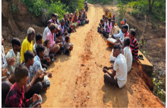
સમયથી રસ્તો નહીં બનતા ગ્રામજનોએ અનોખો વિરોધ નોંધાવ્યો હતો. રામધૂળ બોલાવવા માટે મજબૂર થતાં નમરા ફળિયા વિસ્તાર ની પ્રાસ વિગતો અનુસાર કાલોલ તાલુકાના મેદાપુર ગ્રામ

કાલોલ પંચમહાલ માં છે દા કેટલાય વર્ષો પહેલા ખાત મુહૂર્ત થયું હોવા છતાં નહીં બની રહેલા રોડ માટે ગ્રામજનો એ રામધૂળ બોલાવી પ્રભુ શ્રી રામ પાસે પોતાના રસ્તા ની માગણી કરી અનોખો વિરોધ નોંધાવ્યો હતો. કાલોલ તાલુકાના મેદાપુર ગ્રામ પંચાયતના નમરા ફળિયાના રસ્તા વિહોણા લોકોએ ભગવાન શ્રીરામે લંકા પહોંચવા જે રીતે રામસેતુનું નિર્માણ કર્યું હતું તેવી જ રીતે રામધૂળ કરી ભગવાન રામ અમને પણ રસ્તો બનાવી આપશે તેવી કડૂણ કથની વ્યક્ત કરી કાલોલ તાલુકાના મેદાપુર ગ્રામ પંચાયતના નમરા ફળિયામાં વસવાટ કરતા ગ્રામજનોને અવરજવર કરવા માટે આઝાદીના