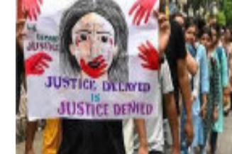
તેમને લાગે છે કે કોર્ટ તેમની તરફેણમાં નહીં. હું તેમને કામ પર પાછા ફરવાની અપીલ કરીશ કારણ કે સામાન્ય લોકો મુશ્કેલીનો સામનો કરી રહ્યા છે. ડોક્ટરોનું કહેવું છે કે અમે સુપ્રીમ કોર્ટના નિર્ણયની રાહ જોઈશું. આ ઉપરાંત તેમના તરફથી મુખ્ય સચિવને હટાવવાની પણ માંગ કરવામાં આવી છે. જણાવી દઈએ કે ૪૨ ડોક્ટરોનું એક પ્રતિનિધિમંડળ સોમવારે સાંજે લગભગ ૬ વાગ્યે મમતા બેનરજીના ઘરે પહોંચ્યું હતું. આ મીટીંગ દરમિયાન ડોક્ટરો મીટીંગનું લાઈવ સ્ટ્રીમીંગ થવી જોઈએ તેવી તેમની માંગણી સ્વીકારી છે અને તેમની બદલી કરી છે. મમતા દીદીએ ટાવો કર્યાં કે ડોક્ટરો સાથે સારી વાતચીત થઈ છે અને અમે તેમની ૯૯ ટકા માંગણીઓ સ્વીકારી લીધી

કોલકાતા કોલકાતાની આજી કાર મેડિકલ કોલેજમાં ડોક્ટર પર બળાટકાર અને હત્યાની ઘુણાસ્પદ ઘટનાને લઈને ડોક્ટરોમાં હજુ પણ ગુસ્સો છે. સીએમ મમતા બેનરજીએ સોમવારે તેમના નિવાસસ્થાને ડોક્ટરો સાથે બેઠક કરી હતી. વાતચીતનો આ પમો રાઉન્ડ હતો અને ત્યાર બાદ તેમણે કહ્યું કે અમે ડોક્ટરોની ૯૯ ટકા માંગણીઓ સ્વીકારી લીધી છે. આ બિન-શિક્ષણ કર્મચારીઓની સલામતી સુનિશ્ચિત કરવા માટે કેટલીક મહત્વપૂર્ણ માર્ગદર્શિકાઓ બહાર પાડી છે જે નીચે મુજબ છે. તમામ વિદ્યાર્થીઓ, સ્ટાફ અને સુલાકાતીઓ કેમ્પસમાં હોય ત્યારે દરેક સમયે માર્ક પહેરે અને વર્ગખંડો, પ્રવેશદોરો અને સામાન્ય વિસ્તારોમાં હેન્ડ સેનિટાઇઝર ઉપલબ્ધ કરાવીને ચેપનું જોખમ ઘટાડવા માટે વારંવાર હાથ ધોવાને પ્રોત્સાહિત કરો. પ્રવેશ દ્વાર પર દરરોજ તાપમાન તપાસો અને તાવ, માથાનો દુખાવો અને શ્વસન સમસ્યાઓ જેવા લક્ષણોનું નિરીક્ષણ કરો. લક્ષણો ધરાવતા વિદ્યાર્થીઓ અથવા સ્ટાફને ઘરે રહેવા અને તાત્કાલિક તબીબી સારવાર લેવાની સલાહ આપવી જોઈએ.