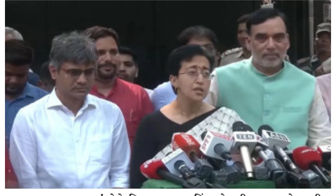
ભાજપના તમામ ધડચંત્રોને નિષ્ફળ બનાવ્યા છે. જ્યારથી મુખ્યમંત્રી અરવિંદ કેજરીવાલે પદ પરથી રાજીનામું આપવાની જાહેરાત કરી હતી ત્યારથી એવી અટકળો ચાલી રહી હતી કે અરવિંદ કેજરીવાલ આતિશીને પોતાનો રાજકીય ઉત્તરાધિકારી બનાવી શકે છે. તેની પાછળનું એક મોટું કારણ એ છે કે

ધારાસભ્ય દળની બેઠક યોજાઈ હતી. આ બેઠકમાં કેજરીવાલે તમામ ધારાસભ્યોની સામે આતિશીના નામનો પ્રસ્તાવ મૂક્યો હતો. જેને તમામ ધારાસભ્યોએ ટેકો આપ્યો હતો. આતિશી પંજાબી પરિવારમાંથી છે. આમ આદમી પાર્ટીના ધારાસભ્ય સત્યેન્દ્ર જૈન હાલમાં જેલમાં છે. બે ધારાસભ્યો પાર્ટી છોડીને ભાજપમાં જોડાયા છે. જ્યારે એક ધારાસભ્ય પાર્ટી છોડીને કોંગ્રેસમાં જોડાયા છે. ભાજપમાં જોડાયેલા રાજકુમાર આનંદ તેમની ધારાસભ્ય સદસ્યતા ગુમાવી દીધી છે. તેઓ પૂર્વ ધારાસભ્ય બન્યા છે. કેજરીવાલના નિવાસસ્થાને મળેલી બેઠકમાં ૫૭ ધારાસભ્યો હાજર રહ્યા હતા. રાયે કહ્યું કે ભાજપ આમ આદમી પાર્ટીને ખતમ કરવા માંગે છે. જેલમાંથી બહાર આવ્યા બાદ કેજરીવાલે રાજીનામું આપવાનો નિર્ણય લીધો હતો. અમે