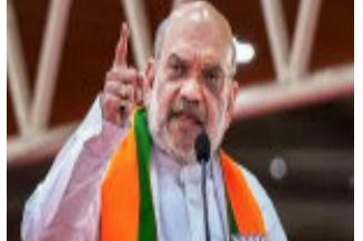
૧૧મા વર્ષમાં પ્રવેશવું ખૂબ મુશ્કેલ છે. સરકારની સિદ્ધિઓ ગણાવતા તેમણે કહ્યું હતું કે લગભગ ૧૫ લાખ કરોડ રૂપિયાના પ્રોજેક્ટ ૧૦૦ દિવસમાં શરૂ, સરકારે ૧૦૦ દિવસને ૧૪ ધિવરમાં વિભાજિત કર્યાં, ૧૦૦ દિવસમાં ઈન્ફ્રાસ્ટ્રક્ચરમાં ૭ લાખ કરોડ રૂપિયાના પ્રોજેક્ટ્સની જાહેરાત, તેના પર પણ કામ શરૂ થયું, મહારાષ્ટ્રના વઢવાણમાં ૭૬ હજાર કરોડના ખર્ચે મેગા પોર્ટ બનાવવાની જાહેરાત પહેલા જ દિવસથી વિશ્વના ૧૦૦ મોટા બંદરોમાં સામેલ થશે, ૪૮ હજાર કરોડના ખર્ચે ૨૫ હજાર ગામોને પાકા રસ્તાઓથી જોડવાની યોજનાનો પ્રારંભ, ૧૦૦ની વસ્તીવાળા ગામોને જોડશે, ૫૦,૬૦૦ કરોડના ખર્ચે ભારતના મુખ્ય રસ્તાઓનું વિસ્તરણ કરવાનો નિર્ણય, વારાણસીમાં લાલ બહાદુર શાસ્ત્રી ઈન્ટરનેશનલ એરપોર્ટ, પશ્ચિમ બંગાળમાં બાગોડોગરા, બિહારમાં બિહાર એરપોર્ટ અને અગાટી અને મિનિકોચમાં નવી એરસ્ટીપ્સનું નિર્માણ કરીને પ્રવાસનને પ્રોત્સાહન આપવાના પ્રયાસો, બેંગલુરુ

નવીદિલ્હી વડાપ્રધાન નરેન્દ્ર મોદી સરકારના ત્રીજા કાર્યકાળના ૧૦૦ દિવસ પૂર્ણ થયા છે. આ પ્રસંગે કેન્દ્રીય ગૃહ પ્રધાન અમિત શાહ અને કેન્દ્રીય પ્રધાન અશ્વિની વૈષ્ણવે એક પુસ્તિકા લોન્ચ કરી અને સરકારની સિદ્ધિઓની ગણતરી કરી. અમિત શાહે કહ્યું કે આજે વડાપ્રધાન મોદીજીનો જન્મદિવસે દેશભરમાં ઘણી સંસ્થાઓએ તેમના જન્મદિવસને સેવા પખવાડા તરીકે ઉજવવાનું નક્કી કર્યું છે. ૧૭મી સપ્ટેમ્બરથી રજા ઓક્ટોબર સુધીના ૧૫ દિવસ સુધી અમારા જેવા અનેક કાર્યકરો દેશભરમાં જરૂરિયાતમંદોની સેવામાં રોકાયેલા રહેશે. તેમણે કહ્યું કે મોદીજીનો જન્મ એક નાનકડા ગામના ગરીબ પરિવારમાં થયો હતો અને તેઓ કૃષિના સૌથી મોટા લોકતંત્રના વડાપ્રધાન બન્યા હતા. છેલ્લા ૧૦ વર્ષમાં દુનિયાના ૧૫ અલગ-અલગ દેશોએ મોદીજીને તેમના દેશના સર્વોચ્ચ પુરસ્કારથી સન્માનિત કર્યાં છે. આનાથી માત્ર વડાપ્રધાનનું જ નહીં પરંતુ દેશનું પણ ગૌરવ વધ્યું છે. ૬૦ વર્ષ પછી પહેલીવાર દેશમાં રાજકીય સ્થિરતાનું વાતાવરણ છે અને આપણે નીતિઓની સાતત્યતાનો પણ અનુભવ કર્યો છે. ૧૦ વર્ષ સુધી નીતિઓની દિશા, નીતિઓની ગતિ અને નીતિઓના સચોટ અમલીકરણને જાળવી રાખ્યા પછી