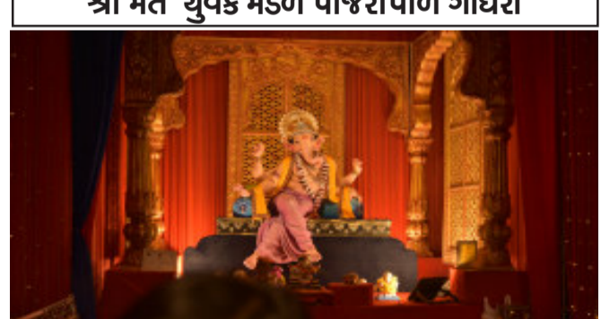
ગ્રીન પાર્ક સોસાયટી ચુપક મંડળ ગોધરા