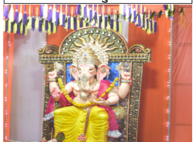
પ્રભાકુંજ સોસાયટી ચુપક મંડળ ગોધરા