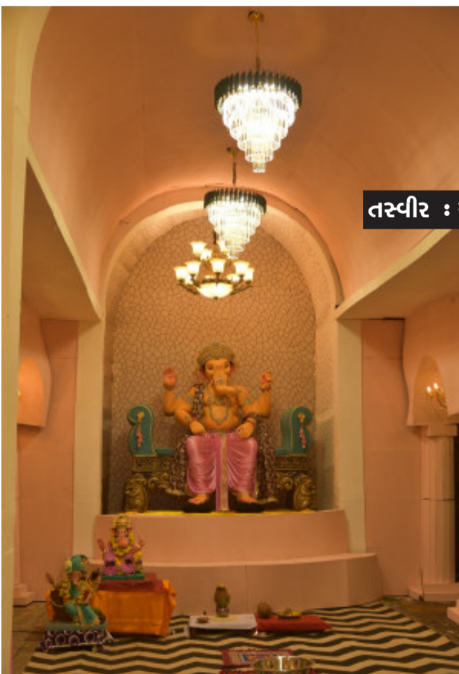
રાધા કિષ્ના ચુપક મંડળ ગોધરા