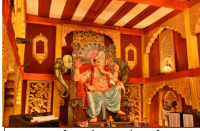
રાચનવાડી પરમહંસ ચુપક મંડળ ગોધરા