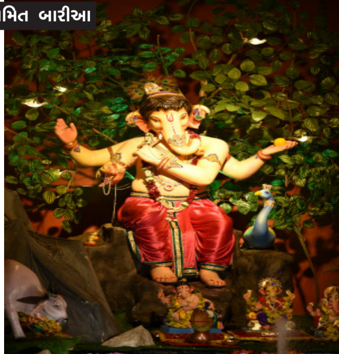
પ્રભાકુંજ સોસાયટી ચુપક મંડળ ગોધરા