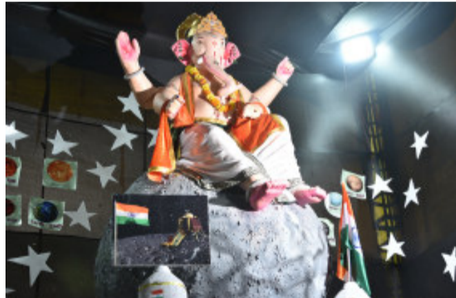
સાઈ ગ્રુપ જુલેલાલ સોસાયટી ચુપક મંડળ ગોધરા

દરમિયાન લોકોની અવરજવર રહેતી હોય એના કારણે જાગૃત નાગરિક દ્વારા નગર પાલિકા કચેરી ખાતે મોખિક રજૂઆત પણ આ બાબતને લઈને કરવામાં આવી હોવાનું જાણવા મળેલ હતું. પાલિકા સહિતના સંબંધિત તંત્ર દ્વારા સતત વાહનોની અવરજવર વાળા રસ્તા ઉપરની ગટર પર લાગેલી તુટી ગયેલ લોખંડની ચેનલની તાત્કાલિક મરામત કરવામાં આવે કે પછી નવી નાખવામાં આવે તે હાલની પરિસ્થિતિને જોતા અત્યંત જરૂરી લાગી રહ્યું છે. નગર વિસ્તારમાં પાણી સહિતની સમસ્યાઓ દિન પ્રતિદિન વધતી જતી હોય ત્યારે જાગૃત નાગરિક દ્વારા ગાંધીનગર ખાતે રજૂઆત કરનાર હોવાનું જાણવા મળ્યું ખાસ કરીને દિવસ અને રાત્રિ