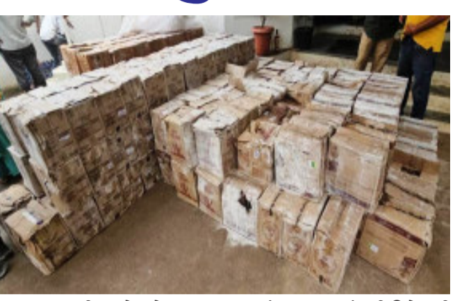
ટ્રક ચાલક નાસી છુટ્યો હતો. ઝાલોદ પોલીસ દ્વારા ટ્રક ચાલક નાસી જતાં ટ્રક ચેક કરવા જતા નીચેથી ગાડીમાં પી.ઓ.પી.નો સિમેન્ટ ભરેલ જોવા મળ્યો હતો. પોલીસને

ઝાલોદ, ઝાલોદ પોલીસ સ્ટેશનના પી.એસ.આઈ એમ.એમ.માળી અને સે.પો.ઈ.સી.કે.સી.સોદીયા પોલીસ સ્ટાફને સાથે રાખી રાજસ્થાન સરહદે આવેલ ઘાવડીયા ચેક પોસ્ટ પર ગુનાહિત પ્રવૃત્તિ કરનારા ઇસમોની વોચ કરી ગાડી ચેક કરી રહેલ હતા. તે દરમિયાન ચેક પોસ્ટ પર એક અશોક લેલેન ટ્રક RJ-27-GA-8166 મોનાડુંગર (રાજસ્થાન) તરફથી ઝાલોદ (ગુજરાત) આવી રહેલ હતી ત્યારે દૂરથી પોલીસને ગાડીઓ ચેક કરતા જોતા ટ્રક ચાલક રસ્તા પર ગાડી મૂકી નાસી ગયેલ હતો. પોલીસ દ્વારા ટ્રક ડ્રાઈવરને દૂરથી નાસતા જોઈ પકડવા દોડ્યા હતા પણ