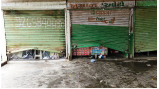
તેમાંથી રોકડ રકમ તથા સામાનની ચોરી કરી હતી. ત્યારબાદ આ તસ્કરો નજીકની વહીવટનગર સોસાયટીમાં

ઘોઘંબા, ઘોઘંબા નગરમાં ગતરાત્રે તસ્કરોએ હાઈસ્કુલ સામે આવેલ શોપીંગ સેન્ટરની દુકાનો જીમ તથા બે મકાન મળી કુલ ૧૦ જગ્યા ઉપર તાળા તોડી હજારોની મત્તા ચોરી કરાઈ ચર્ષજતા નગરજનોમાં ફફડાટ ફેલાયો હતો. ગત રાત્રે ૩:૦૦ વાગ્યાના સમયે ઘોઘંબા નગરવાસીઓ વરસાદના કારણે મીઠી નીંદર માણી રહ્યા હતા. તે દરમિયાન કેટલાક યુવાન દેખાતા ઈસમોએ એસ.એચ.વરીયા હાઈસ્કુલ સામે આવેલ શોપીંગ સેન્ટરની દુકાનોના તાળા તોડી શટલ ઉઠ્યા કરી