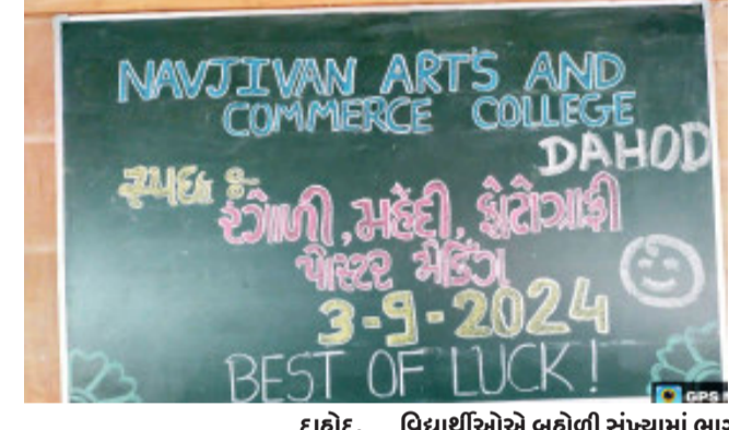
દાહોદ, દાહોદ અનાજ મહાજન સાર્વજનિક એજ્યુકેશન સોસાયટી, દાહોદ સંચાલિત નવજીવન આર્ટ્સ એન્ડ કોમર્સ કોલેજ, દાહોદ ખાતે સાંસ્કૃતિક સમિતિ અને વિદ્યાર્થી સમિતિ દ્વારા રંગોલી, મહેંદી, ફોટોગ્રાફી તેમજ પોસ્ટર મેકિંગ જેવી સ્પર્ધાઓમાં નિહાળિક તરીકે કોલેજના અધ્યાપકોએ સેવા આપી હતી. આ પ્રસંગે સાંસ્કૃતિક સમિતિના દરેક સભ્યો હાજર રહ્યા હતા.