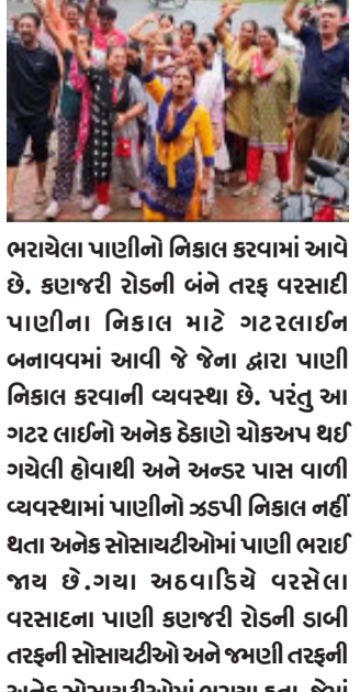
ભરાયેલા પાણીનો નિકાલ કરવામાં આવે છે. કણજરી રોડની બંને તરફ વરસાદી પાણીના નિકાલ માટે ગટરલાઈન બનાવવામાં આવી જે જેના દ્વારા પાણી નિકાલ કરવાની વ્યવસ્થા છે. પરંતુ આ ગટર લાઈને અનેક હેડાઓ ચોક્કસ થઈ ગયેલી હોવાથી અને અન્ડર પાસ વાળી વ્યવસ્થામાં પાણીનો ઝડપી નિકાલ નહીં થતા અનેક સોસાયટીઓમાં પાણી ભરાઈ જતા મહાદેવ મંદિર પાસેથી કણજરી ગામમાં જવાના અન્ડર પાસ દ્વારા અને સ્વામિનારાયણ મંદિરની આગળ હાઈવેની અડીને ખોદકામ કરીને સોસાયટીઓમાં

હાલોલ, હાલોલમાં પડેલા અતિ ભારે વરસાદમાં વિશ્વામિત્રી નદીના કોતરો ઉભરાય હતા અને તેના પાણી હાલોલના અનેક વિસ્તારોમાં ફરી વળ્યાં હતા. આ સ્થિતિ પછી વરસાદે વિરામ લીધો હોવા છતાં કેટલાક વિસ્તારોમાં વરસાદી પાણી ઓસાઈ નથી. તો બીજી તરફ પાલિકા દ્વારા આ પાણીનો નિકાલ કરવાની કામગીરી કરવામાં આગસ દાખવતા કેટલીક સોસાયટીઓના મકાનોમાં ભરાયેલા પાણી નહીં નીકળતા લોકો પરેશાન થઈ ગયા છે.