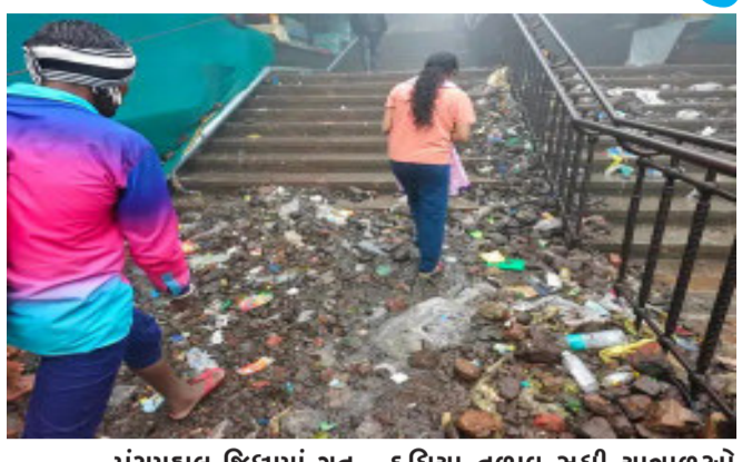
પંચમહાલ જિલ્લામાં ગત સપ્તાહમાં ભારે વરસાદ વરસ્યો હતો. ભારે વરસાદને લઈ પાવાગઢ યાત્રાધામ ડુંગર ઉપર માંચીથી

ધસરાઈને રેવાપથના પગથિયા ઉપર પડેલ છે. પથ્થર અને માટીના કાટમાળને લઈ પગથિયા ચઢીને દર્શન માટે જતાં યાત્રાળુઓ માટે જોખમી બન્યો છે. હાલ રેવાપથના પગથિયા ઉપર પડેલ પથ્થરોને સ્થાનિક દુકાનદારો મહેનત કરીને હટાવવાના પ્રયાસો કરતા હોય છે. પરંતુ મોટા પ્રમાણમાં ડુંગર ઉપરથી પથ્થર અને માટી ઘસડાઈ આવે હોય તે દુર કરવા માટે દુકાનદારો સક્ષમ નથી. બનેલ રેવાપથના પગથિયા પરના પથ્થર અને માટી દુર કરવામાં માટે તંત્ર દ્વારા તાત્કાલિક કાર્યવાહી કરાય તે જરૂરી બન્યું છે.