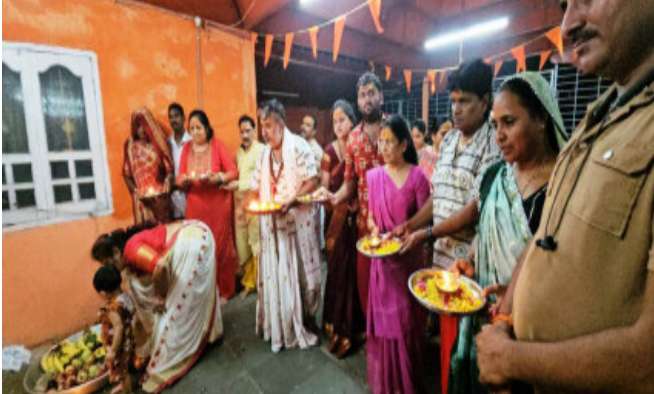
શ્રાવણ માસ ભગવાન ભોળાનાથનો સૌથી પ્રિય છે. આ મહિનામાં સોમવારનું પ્રત અને શ્રાવણ માસમાં બેલપત્રથી ભગવાન શિવજીની પૂજા કરવામાં આવે છે અને તેમને જળાભિષેક કરવું ખૂબ જ ફળદાયી માનવામાં આવે છે. શ્રાવણ મહિનામાં ભગવાન શિવજીની પૂજા આરાધનાનું વિશેષ વિધાન છે. શ્રાવણ માસ શિવજીની સાથે માતા પાર્વતીને પણ સમર્પિત છે. ભક્ત શ્રાવણ મહિનામાં સાચા મનથી અને સંપૂર્ણ શ્રદ્ધાની સાથે મહાદેવનું પ્રત ધારણ કરે છે અને તેમને શિવના આશીર્વાદ અવશ્ય પ્રાપ્ત થાય છે. વિવાહિત મહિલાઓ અને વૈવાહિક