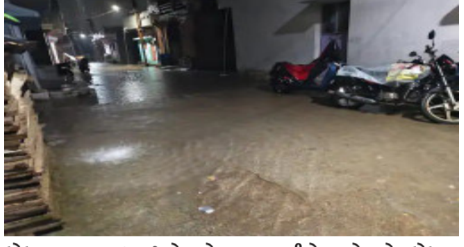
ઘોઘમાર વરસાદ શરૂ થયો હતો. ઘોઘમાર વરસાદને લઈ શહેરના માર્ગો ઉપર પાણી ભરાયા હતા અને નિયાણવાળા વિસ્તારોના રહિશોના ઘરોમાં વરસાદી પાણી ભરાયા હતા. પંચમહાલ જીલ્લામાં સાર્વજનિક વરસાદને લઈ ખેતરોમાં ઉભા મકાઈના પાકને નુકશાન થવાથી ખેડુતો ચિંતા

ગોધરા, પંચમહાલ જીલ્લા સહિત ગોધરામાં ગતરોજ વહેલી સવારથી વરસાદી માહોલ જામ્યો હતો. બપોર બાદ વરસાદે વિરામ લીધો હતો. મોડી સાંજે ઘોઘમાર વરસાદ શરૂ થયો રાત્રીના સમયે ચાલેલ વરસાદને લઈ ગોધરાના નિયાણવાળા વિસ્તારોમાં પાણી ભરાયા હતા.