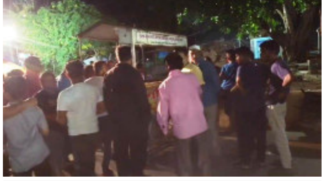
દાહોદ નગરપાલિકા દ્વારા કોઈ પણ પ્રકારની જાણ કરવામાં આવી ન હતી અને રાત્રિના સમયે આવી અચાનક અમારી લારીઓ ઉપાડી લઈ જવાની કામગીરી કરતા હતા તે સમયે અમોને જાણ હતા અમે સ્થળ પર પહોંચી ગયા હતા ત્યારે અમે અમારી લારી ખસેડી લીધા બાદ પણ પાલિકા તંત્ર દ્વારા અમારી લારીની તોડફોડ કરી નુકસાન કરવામાં આવ્યું છે.

પરંતુ દાહોદ શહેરમાં સ્માર્ટ સિટીના નામે આખી વળગીને ઉડે તેવી કોઈ કામગીરી અત્યાર સુધી જોવા મળી નથી ત્યારે દાહોદ નગરપાલિકાના