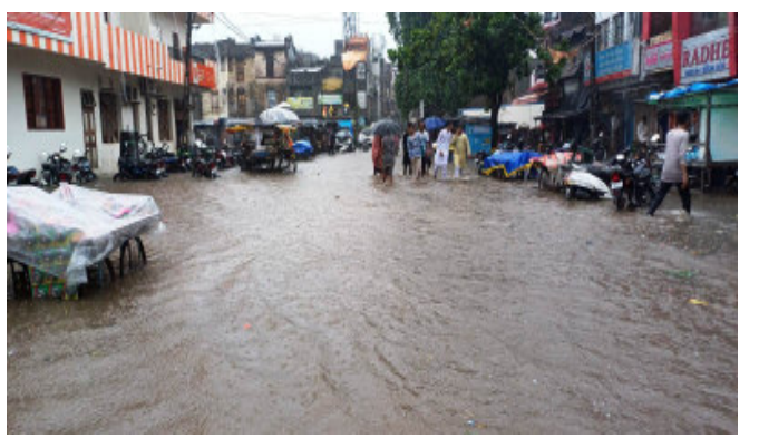
સાથે મેઘરાજાએ વિરામ લેતા ઘરતીપુત્રો પણ વિસામણમાં મુકાયા હતા. ત્યારે લાંબા વિરામ બાદ આજરોજ પંચમહાલ જીલ્લા સહિત ગોધરામાં બપોર બાદ વાતાવરણ પલટાયું હતું અને મેઘરાજાએ ધમાકેદાર એન્ટ્રી કરી ઘોઘમાર વરસાદ પડતાં શહેરના શહેરા ભાગોળ, સિંદુરી માતા મંદિર તેમજ નિયાણાવાળા વિસ્તારમાં પાણી ભરાયા હતા. ગોધરાના કેટલાક વિસ્તારોમાં ગટર લાઈન બ્લોક થઈ જતાં ગંદુ પાણી પણ રોડ ઉપર વહેવા માંડ્યું. જેને લઈ વાહન ચાલકો તેમજ રાહદારીઓને ભારે હાલાકી વેઠવી પડી હતી. ગોધરા શહેરમાં કલેક્ટર કચેરી કંપોઉન્ડ, જીલ્લા પંચાયત કચેરી

ગોધરા, પંચમહાલ જીલ્લા સહિત ગોધરામાં લાંબા વિરામ બાદ આજે બપોર બાદ મેઘરાજાએ ધમાકેદાર એન્ટ્રી કરતાં ગોધરા શહેરના રસ્તાઓ ઉપર પાણી ભરાયેલ જોવા મળ્યા હતા. જીલ્લામાં લાંબા સમયની મેઘરાજાએ વિરામ લેતાં અસહ્ય ઉકળાટ અને બફારાથી લોકો પરેશાન હતા. ત્યારે મેઘરાજા મહેરબાન થતાં વાતાવરણમાં પ્રસરી હતી. સાથે મેઘરાજાની પૂનઃ પધરામણી થતાં ખેડૂતોમાં આનંદ જોવા મળ્યો. પંચમહાલ જીલ્લા સહિત ગોધરામાં મેઘરાજાએ લાંબા વિરામ બાદ લેતાં છેલ્લા કેટલાક દિવસોથી અસહ્ય ગરમી અને બફારાને લઈ લોકો ત્રાહિમામ પોકારી ઉઠ્યા હતા