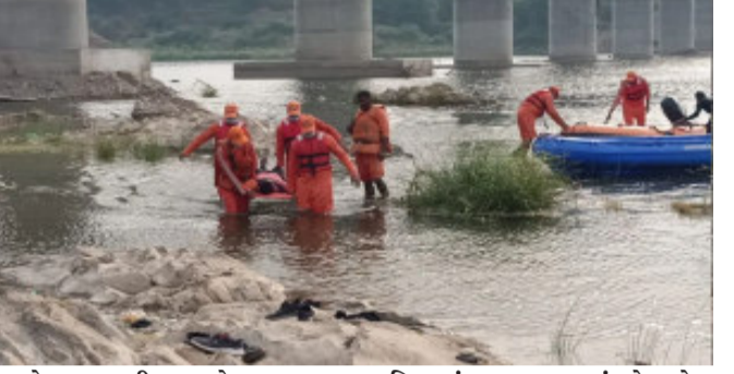
આવેલા પૂર પછી ગુમ થયેલા લગભગ ૩૦ લોકોને શોધવા માટે બચાવ કામગીરી કરવામાં આવી રહી છે, પરંતુ કોઈ મોટી સફળતા મળી નથી.

શિમલા હિમાચલ પ્રદેશમાં રવિવારથી સતત વરસાદ પડી રહ્યો છે. દરમિયાન અનેક જગ્યાએ વરસાદને કારણે ભૂસ્ખલન અને પૂર જેવી સ્થિતિ સર્જાઈ છે. આ વિસ્તારની ઘણી નદીઓ ઉછળી રહી છે અને ઘણી જગ્યાએ ભૂસ્ખલન પણ જોવા મળ્યું છે. હિમાચલ પ્રદેશમાં પૂર અને ભૂસ્ખલનને કારણે ચાર રાષ્ટ્રીય ધોરીમાર્ગો સહિત કુલ ૩૩૮ રસ્તાઓ બંધ કરી દેવામાં આવ્યા છે. અધિકારીઓએ આ અંગે માહિતી આપી હતી. અધિકારીઓએ સોમવારે જણાવ્યું હતું કે વરસાદના કારણે ઉનાના ઘણા વિસ્તારો પાણીમાં ડૂબી ગયા છે. તેમણે કહ્યું કે કુલ્લુ, મંડી અને શિમલા જિલ્લામાં ૩૧ જુલાઈએ