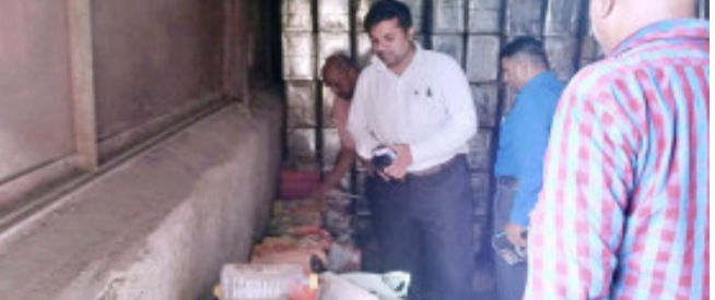
૧૫ કિગ્રાના અલગ અલગ માર્કવાળા પામ ઓઇલના ૧૯ ટીન ભરેલા ટીન જેની કિંમત રૂપિયા ૨૭,૫૫૦/- તથા ખાલી ટીન ૧૫ કિગ્રાના ૨૦૦૦ નંગ જેની કિંમત રૂપિયા ૫૦,૦૦૦/- તથા ૦૫ લીટરના તેલ ભરવાના ખાલી કારબા ૨૪૦૦ નંગ જેની કિંમત રૂપિયા ૫૨,૮૦૦/- તથા ૦૧ લીટરના ખાલી બોટલ ૪૩૨૦ નંગ જેની કિંમત રૂપિયા ૨૫,૯૨૦/- તથા ૫૦૦ મિલી ખાલી બોટલ ૨૭૩૭ નંગ જેની કિંમત રૂપિયા ૮,૨૧૧/- તથા પેકેજીંગ મશીનરી

ગોધરા, પંચમહાલ જીલ્લા પુરવઠા અધિકારી અને નાયબ કલેક્ટર, પંચમહાલ ગોધરા અને તેઓની જીલ્લાની ટીમ તથા મામલતદારશ્રી કાલોલ તથા તેઓની ટીમ તેમજ જીલ્લા પુરવઠા મેનેજર ટ્રેડ-૨ સંયુક્ત ટીમો દ્વારા કાલોલ તાલુકાના દેલોલ ગામે બરોડા-ગોધરા હાઇવેની બાજુમાં આવેલ શ્રીનાથ પ્રોટીન્સ એકમની આકસ્મિક તપાસ કરતા શ્રીનાથ પ્રોટીન્સ એકમમાં મીશા એન્ટર પ્રાઇવેટ લિમિટેડના પામ તેલ લાવી શ્રીનાથ પ્રોટીન્સ એકમમાં અનઅધિકૃત રીતે ધ્યાન કાલોલ તાલુકાના માર્કવાળા રીફાઇન્ડ કપાસિયા ઓઇલ તેમજ રીફાઇન્ડ વેજીટેબલ ઓઇલના અનઅધિકૃત કંપનીના માર્ક લગાવી ભેળસેળ ચુકત રીફાઇન્ડ તેલનું વેચાણ કરતા જણાઈ આવેલ છે. શ્રીનાથ પ્રોટીન્સ એકમ માંથી તેલના