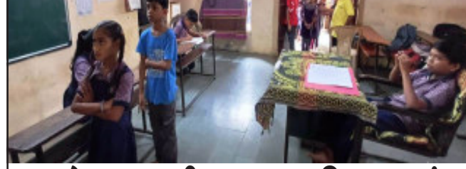
કાલોલ તાલુકાની પલાસા પ્રાથમિક શાળામાં લોકશાહી ઢબે બાલ સાંસદની ચૂંટણી ચોખ્ખી કરવામાં આવી.