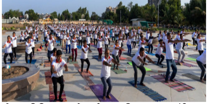
યોગના વિવિધ આસનો કર્યા હતા. આ કાર્યક્રમમાં સ્વામીનારાયણ મંદિરના કોઠારી સ્વામી સર્વ મંગલદાયક સ્વામી, સંતરામ મંદિરના સંત

નડિયાદ, અ. ગ. મ. ૧ આંતરરાષ્ટ્રીય યોગ દિવસ ઉજવણીના ભાગરૂપે ગુજરાત રાજ્ય યોગ બોર્ડ દ્વારા સ્વામીનારાયણ મંદિર (BAPS) પીપલગ ના પરિસરમાં યોગ કાર્યક્રમ યોજાયો હતો. જેમાં યોગકોચ, યોગટ્રેઇનર્સ અને ૫૫૦ થી વધુ યોગસાધકોએ ભાગ લઈ