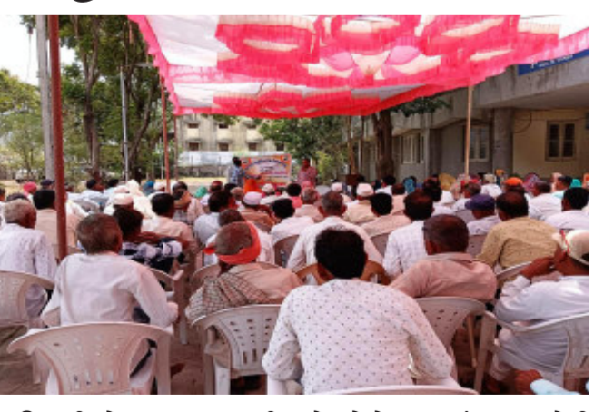
અધિકારીઓ દ્વારા ૨૦૦ થી વધારે ખેડૂતોને પ્રાકૃતિક કૃષિ અંગે તાલીમ આપવામાં આવી હતી. આ તાલીમમાં ઘન જીવામૃત, બીજામૃત તેમજ વિવિધ રોગનાશક અસ્ત્રોનું નિદર્શન પણ યોજવામાં આવ્યું હતું. તાલીમનો મુખ્ય હેતુ ખેડૂતોને પ્રાકૃતિક ખેતી વિશે સમજણ આપવા ઉપરાંત પ્રાકૃતિક ખેતીનું મહત્વ,

ગોધરા, પ્રાકૃતિક ખેતીથી જમીન, પર્યાવરણના સંરક્ષણ અને સંવર્ધન સાથે જન આરોગ્યની સુખાકારી થાય છે અને ખેડૂતોને ખેતીનો ખર્ચ પણ ઘટે છે. વડાપ્રધાનશ્રી નરેન્દ્રભાઈ મોદીના નેતૃત્વ અને મુખ્યમંત્રી ભૂપેન્દ્રભાઈ પટેલના માર્ગદર્શનમાં રાજ્યમાં પ્રાકૃતિક ખેતીની સૂચના ચાલી રહી છે. ત્યારે પંચમહાલ જીલ્લામાં વધુમાં વધુ ખેડૂતો પ્રાકૃતિક કૃષિ અપનાવે તે માટે ગુજરાત પ્રાકૃતિક કૃષિ વિકાસ બોર્ડ અંતર્ગત આત્મા પ્રોજેક્ટ, પંચમહાલ દ્વારા પ્રાકૃતિક ખેતી માટે ઘોઘંબા તાલુકામાં તાલીમનું આયોજન કરવામાં આવ્યું હતું.