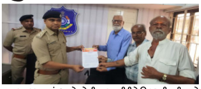
તપાસ કરવામાં આવે તેવી માંગણી કરવામાં આવી છે. ગતરોજ લીમડી નગરના ગોધરા રોડ ખાતે આવેલ એક ભગવાન શિવજીના મંદિરના પટાંગણની બહાર બકરાનું વાહેલું માથું મળી આવ્યું હતું. ઘટનાને પગલે સ્થાનિક હિન્દુ સમાજના લોકોએ આ અંગેની સ્થાનિક પોલીસને જાણ કરતાં પોલીસે તપાસ કરતાં આ બકરાનું વાહેલુ માથુ ત્રણ-ચાર દિવસ પહેલાનું હતું. અતિ દુર્ઘટ મારી રહ્યું હોય એવું કહે, જેને કુતરા અથવા અન્ય કોઈ જાનવર દ્વારા અહીં સુધી લઈ આવવામાં આવ્યું હશે ? જે તપાસમાં જણાવ મળ્યું હતું જે મામલે સ્થાનિક હિન્દુ સમાજના લોકો દ્વારા પોલીસની

દાહોદ, જીદાના કાલોદ તાલુકાના લીમડી નગરમાં ગતરોજ એક ભગવાન શિવજીની મંદિરના પટાંગણની બહાર બકરાનું વાહેલુ માથું મળી આવ્યું હતું. જેમાં સ્થાનિક પોલીસે તપાસ કરતાં આ બકરાનું માથુ ચાર-પાંચ દિવસ પહેલાનું હતું અને કોઈ કુતરું અથવા કોઈ અન્ય જાનવર દ્વારા મંદિર સુધી લઈ આવ્યું હતું. ત્યારે પોલીસની આ કામગીરીને બિરદારી શ્રી રામ સેવા સમિતિ, દાહોદ દ્વારા લીમડી પોલીસ મથકના પીઆઈને આવેદનપત્ર આપી જણાવ્યું હતું કે, લીમડી નગરમાં લાયસન્સ વગરના કતલખાના ધમધમતી રહ્યાં છે. તેની સામે કાર્યવાહીની માંગણી સાથે લાયસન્સ ધરાવતાં કતલખાનાઓ દ્વારા વેસ્ટેજ કચરો જાહેર રસ્તાઓ તેમજ હિન્દુ ધર્મ સ્થાનોની આગળ ફેંકી દેવામાં આવતાં હોવાના આક્ષેપો સાથે સાથે આ મામલે પણ