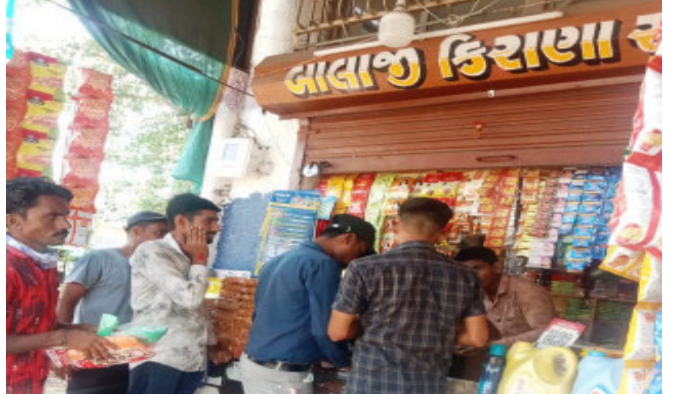
વેપારીઓ સામે તપાસ કરવામાં આવી હતી. બાલાસિનોર નગરપાલિકાના ઈન્ચાર્જ ચીફ ઓફિસર, સેનેટરી ઈન્સ્પેક્ટર, કલાર્ક સહિતની ધીમે શહેરમાં ચાલી જેટલી દુકાનો અને લારી ગઈ તપાસ કરી હતી. આ જગ્યાઓ ઉપરથી ૬ કલ

બાલાસિનોર, બાલાસિનોર : બાલાસિનોર નગરપાલિકા દ્વારા શહેરમાં પ્રતિબંધિત પ્લાસ્ટિક વેચતા વેપારીઓ અને લારીઓ ઉપર તપાસ કરવામાં આવી હતી અને ૬ કિલો પ્લાસ્ટિક જપ્ત કરી લઈ કાર્યવાહી કરાઈ હતી. નગરપાલિકાના ચેફિંગને પગલે પ્રતિબંધિત પ્લાસ્ટિક વેચતા વેપારીઓમાં ફાફડાટ ફેલાવે છે. બાલાસિનોરનો સ્વચ્છતા જળવાઈ રહે તે માટે પ્રતિબંધિત પ્લાસ્ટિક વેચતા