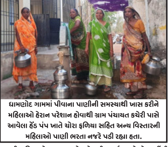
ધામણોદ ગામમાં પીવાના પાણીની સમસ્યાથી ખાસ કરીને મહિલાઓ હેરાન પરેશાન હોવાથી ગ્રામ પંચાયત કચેરી પાસે આવેલા હેડ પંપ ખાતે ચોરા ફળિયા સહિત અન્ય વિસ્તારની મહિલાઓ પાણી ભરતા નજરે પડી રહ્યા હતા.

શહેરા, શહેરા તાલુકામાં સૌથી વધુ વસ્તી ધરાવતું ધામણોદ ગામમાં પીવાના પાણીની સમસ્યા હોવાથી મહિલાઓનો આકોશ સંબંધિત તંત્ર સામે જોવા મળી રહ્યો હતો. ગામના ચોપડા ફળિયા, ચોરા ફળિયા સહિતની અન્ય વિસ્તારની મહિલાઓ હેડ પંપના સહારે પાણી ભરી રહ્યા છે. શહેરા તાલુકાના ધામણોદ ગામ ની વસ્તી ૧૨૦૦૦ કરતા વધુ હોવા સાથે આ ગામમાં ચોપડા ફળિયા, ચોરા ફળિયા સહિત અન્ય વિસ્તારોમાં પીવાના પાણીની સમસ્યા હોવાથી ગ્રામજનો અને પશુપાલકો ને ભારે હાલાકી વેઠવી પડી રહી છે. ગામમાં પાણી