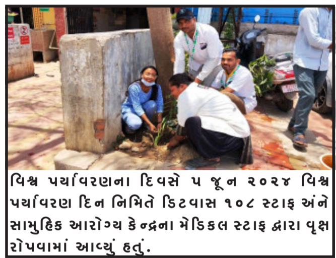
વિશ્વ પર્યાવરણ દિવસે ૫ જૂન ૨૦૨૪ વિશ્વ પર્યાવરણ દિન નિમિત્તે ડિટવાસ ૧૦૮ સ્ટાફ અને સામુહિક આરોગ્ય કેન્દ્રના મેડિકલ સ્ટાફ દ્વારા વૃક્ષારોપણમાં આવ્યું હતું.

દરરોજના પાંચ કલાક સુધી સમર સ્કીલ વર્કશોપ અંતર્ગત વિદ્યાર્થીઓને આઈ.ટી.આઈ. પલાણા ખાતે તાલીમ આપવામાં આવશે. સમર સ્કીલ વર્કશોપમાં પ્રવેશ ઈચ્છુક તાલીમાર્થીઓને માર્ગદર્શન અને ઓનલાઈન ફોર્મ ભરવા સંરંધાના સમય ૧૧:૦૦ થી ૦૫:૦૦ કલાક દરમિયાન જરૂરી આધાર પુરાવા સાથે સંપર્ક કરવા ઔદ્યોગિક તાલીમ સંસ્થા પલાણા દ્વારા જણાવવામાં આવે છે.