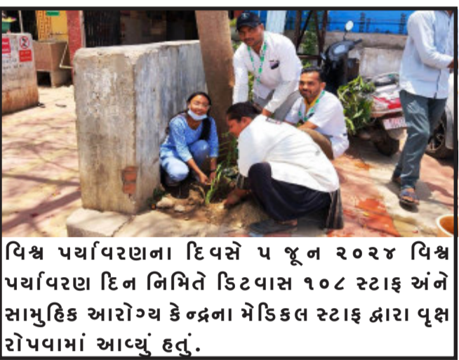
વિશ્વ પર્યાવરણ દિવસે ૫ જૂન ૨૦૨૪ વિશ્વ પર્યાવરણ દિન નિમિત્તે કિટવાસ ૧૦૮ સ્ટાફ અને સામુહિક આરોગ્ય કેન્દ્રના મેડિકલ સ્ટાફ દ્વારા વૃક્ષારોપણમાં આવ્યું હતું.

દરરોજના પાંચ કલાક સુધી સમર સ્કીલ વર્કશોપ અંતર્ગત વિદ્યાર્થીઓને આઈ.ટી.આઈ. પલાણા ખાતે તાલીમ આપવામાં આવશે. સમર સ્કીલ વર્કશોપમાં પ્રવેશ ઈચ્છુક તાલીમાર્થીઓને માર્ગદર્શન અને ઓનલાઈન ફોર્મ ભરવા સંરંધાના સમય ૧૧:૦૦ થી ૦૫:૦૦ કલાક દરમિયાન જરૂરી આધાર પુરાવા સાથે સંપર્ક કરવા ઔદ્યોગિક તાલીમ સંસ્થા પલાણા દ્વારા જણાવવામાં આવે છે.