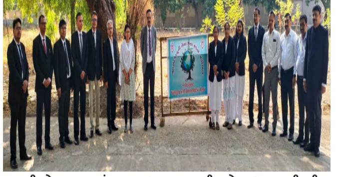
જીદા કાનૂની સેવા સત્તા મંડળ, જીદા ન્યાયાલય ખેડા-નડીયાદનાં ચેરમેન અને મુખ્ય જીદા ન્યાયાધીશ એન.એ.અંબારીઆનાં અધ્યક્ષપણા હેઠળ વૃક્ષારોપણ કાર્યક્રમ યોજાયો. જેમાં જીદા ન્યાયાલય નડીયાદ મુખ્ય મથક ખાતે જીદા

નડિયાદ, મે. ગુજરાત રાજ્ય કાનૂની સેવા સત્તા મંડળ, ગુજરાત હાઈકોર્ટ, અમદાવાદની સુચના અને માર્ગદર્શન અનુસાર તા.૦૫/૦૬/૨૦૨૪ નાં રોજ વિશ્વ પર્યાવરણ દિન નિમિત્તે જીદા કાનૂની સેવા સત્તા મંડળ, જીદા ન્યાયાલય નડીયાદ દ્વારા સામાજિક વનીકરણ વિભાગ ખેડા નડીયાદનાં સહયોગથી જીદા મુખ્ય મથક નડીયાદ તથા તાલુકા મથકે આવેલ તાલુકા કોર્ટોમાં વિશેષ વૃક્ષારોપણ કાર્યક્રમોનું આયોજન કરવામાં આવેલ.