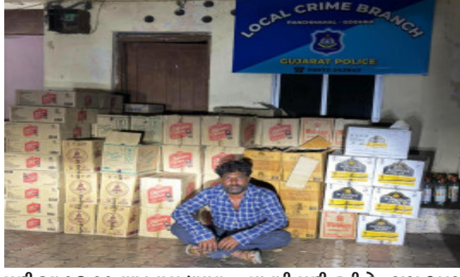
મળી કુલ ૧૬.૧૧ લાખના મુદ્દામાલ સાથે એક ઈસમને ઝડપી પાડવામાં આવ્યો. પ્રાપ્ત વિગતો મુજબ ગોધરા લોકલ ક્રાઈમ બ્રાન્ચને

ગોધરા, એલ.સી.બી.પોલીસને બાતમી મળી હતી કે, ટાટા અલ્ટ્રા કન્ટેનરમાં ચોરખાનું બનાવીને દાહોદ-ગોધરા હાઈવે થઈને ઈંગ્લીશ દારૂનો જથ્થો લઈને કાલોલ તરફ જનાર છે. તેવી બાતમીના આધારે એલ.સી.બી.પોલીસે પરવડી ચોકડી પાસે વોચ ગોઠવી હતી. બાતમીવાળા કન્ટેનરને રોકીને તપાસ કરવામાં આવી હતી. તપાસમાં ઈંગ્લીશ દારૂની નાની-મોટી બોટલો અને બીચર ટીન મળી ૬.૦૬ લાખનો દારૂનો જથ્થો તેમાં