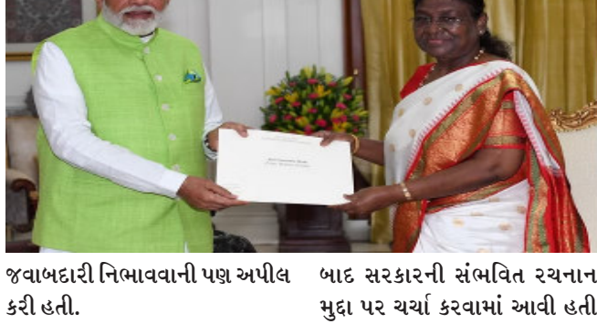
જવાબદારી નિભાવવાની પણ અપીલ કરી હતી. કેન્દ્રીય કેબિનેટની બેઠકમાં લોકસભાની ચૂંટણીના પરિણામો અને ભાજપની આગેવાની હેઠળના એનડીએને ગૃહમાં બહુમતી મળ્યા બાદ સરકારની સંભવિત રચનાના મુદ્દા પર ચર્ચા કરવામાં આવી હતી. સવારે ૧૧.૩૦ વાગ્યે વડાપ્રધાનના નિવાસસ્થાને બેઠક શરૂ થઈ હતી. આ બેઠક બાદ મંત્રી પરિષદની બેઠક પણ યોજાઈ હતી. રિપોર્ટ્સ અનુસાર, ૭

નવીદિલ્હી, વડાપ્રધાન નરેન્દ્ર મોદીએ કેન્દ્રીય કેબિનેટની બેઠકની અધ્યક્ષતા કરી હતી. આ બેઠકમાં ૧૭મી લોકસભાને ભંગ કરવાની ભલામણ કરવામાં આવી હતી. વર્તમાન ૧૭મી લોકસભાનો કાર્યકાળ ૧૬ જૂને પૂરો થઈ રહ્યો હતો. બેઠક બાદ વડાપ્રધાન મોદી રાષ્ટ્રપતિ ભવન પહોંચ્યા અને લોકસભાના વિસર્જનની ભલામણ કરીને રાષ્ટ્રપતિ દ્રૌપદી મુર્મુને તેમના અને અન્ય મંત્રીઓના રાજીનામા સુપરત કર્યાં. જેનો રાષ્ટ્રપતિ દ્રૌપદી મુર્મુએ સ્વીકાર કર્યો હતો. રાષ્ટ્રપતિએ નરેન્દ્ર મોદીને આગામી સરકારની રચના સુધી કાર્યકારી વડાપ્રધાન તરીકે