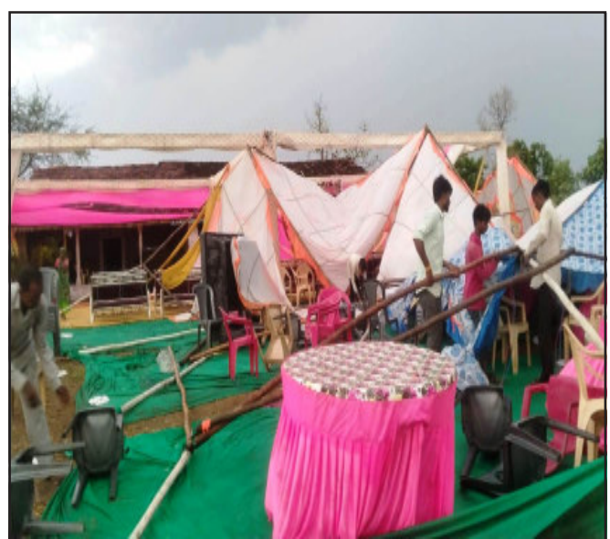
મોરવા તાલુકાના વંટેલી ગામ ચોરા ફળિયામાં અચાનક વાવાઝોડા સાથે વરસાદ આવી જતા મંડપ ઉડી ગયો હતો. અને મોટા પાયે નુકશાન થયું હતું.

સમગ્ર મધ્ય પશ્ચિમ વિસ્તાર સાથે સાથે ગોધરા તાલુકાના પશ્ચિમ વિસ્તારના ગામો નદીસર, ઘરી, ટીંબા, રતનપુર, સહિતના વિસ્તારોમાં અસહ્ય ગરમી બાદ સાંજે વાતાવરણે અણધાર્યો વળાંક લીધો હતો. જોત જોતામાં કાળા ડીબાંગ વાદળો ગોરંભાયા હતા અને ભારે પવન ફૂંકાયો હતો. સાથે સાથે વીજળીના કડાકા ભડાકા સાથે વરસાદનું આગમન થયું હતું અને થોડી વારમાં તો જાણે ચોમાસા જેવો માહોલ સર્જાયો હતો. ભારે પવન તેમજ વરસાદના કારણે સમગ્ર વિસ્તારમાં વીજ પુરવઠો પણ ખોરવાઈ ગયો હતો. આ તરફ ગ્રામ્ય વિસ્તારોમાં ચાલી રહેલ લગ્નસરાની સીઝનમાં સાંજ સમયે વાતાવરણે કવવટ બદલતા પ્રસંગોમાં ભારે મુસીબત ઉભી થઈ હતી. આ તરફ વરસાદના પગલે ખેતીવાડીમાં બાજરી, ડાંગર સહિતના પાકોમાં ખેડૂતો દ્વારા નુકશાનની ભીતિ સેવાઈ રહી છે. આ તરફ વરસાદના કારણે ગ્રામ્ય વિસ્તારોમાં રસ્તા ભીના થયા હતા.