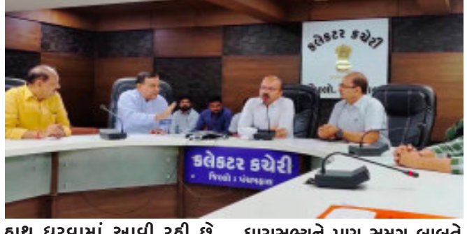
હાથ ધરવામાં આવી રહી છે. ગોધરા શહેરના ભુરાવાવ વિસ્તારમાં આવેલી કેટલીક સોસાયટીઓ સહિત આશરે ૫ હજાર જેટલા ગ્રાહકોની ઘરે સ્માર્ટ વીજ મીટર લગાવવામાં આવ્યા છે. ત્યારે હાલ કેટલાક વીજ ગ્રાહકો દ્વારા સ્માર્ટ વીજ મીટરમાં સમસ્યાઓના આક્ષેપ સાથે કામગીરી સ્થગિત કરવાની માંગ કરવામાં આવી છે. ગોધરા ધારાસભ્યને પણ સમગ્ર બાબતે રજૂઆત કરવામાં આવી છે. જેને લઈને પંચમહાલ જીલ્લા સેવાસદન કચેરી ખાતે જીલ્લા કલેક્ટર, આશિષકુમાર દ્વારા ગોધરા ધારાસભ્ય સી.કે.રાઉલજી, MGVCCLના ઈજનેરને સાથે રાખીને આવા ગ્રાહકો સાથે બેઠક યોજવામાં આવી હતી. જેમાં ગ્રાહકો દ્વારા સ્માર્ટ વીજ મીટર લગાવ્યા બાદ પડી રહેલી

ગોધરા, ગોધરા શહેરના વિવિધ વિસ્તારોમાં આવેલી સોસાયટીઓના રહીશો દ્વારા સ્માર્ટ પ્રિપેડ વીજ મીટર લગાવવાના વિરોધ સાથે જીલ્લા કલેક્ટર સાથે બેઠક યોજવામાં આવી હતી. જેમાં વીજ મીટર લગાવ્યા બાદ પડી રહેલી સમસ્યાઓને લઈને રજૂઆત કરવામાં આવી હતી. જીલ્લા કલેક્ટર દ્વારા MGVCCLના અધિકારીને સાથે રાખીને તમામ સમસ્યાઓના નિકાલ માટે ખાતરી આપવામાં આવી હતી. કેન્દ્ર સરકારના પાચલોટ પ્રોજેક્ટ અંતર્ગત મધ્ય ગુજરાત વીજ કંપની લિમિટેડ દ્વારા વડોદરા બાદ ગોધરા શહેરના વિવિધ વિસ્તારોમાં પ્રિપેડ સ્માર્ટ વીજ મીટર લગાવવાની કામગીરી