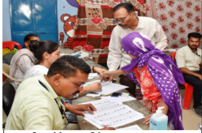
લાકડીના ટેકે આવીને મતદાન કરનાર ૮૫ વર્ષીય બા એ મતદાતાઓનો વધાર્યો ઉત્સાહ