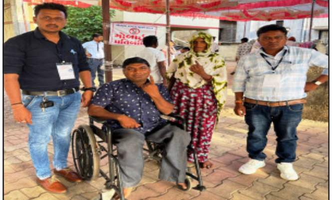
દાહોદમાં દિવ્યાંગજનોએ મતદાન મથકે આવી મત આપી અન્ય મતદારો માટે બન્યા પ્રેરણારૂપ