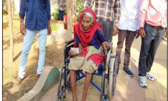
દાહોદમાં દાસા ખાતે ૧૦૦ વર્ષના વૃદ્ધા મતદાન કરવા મતદાન મથકે પહોંચ્યા