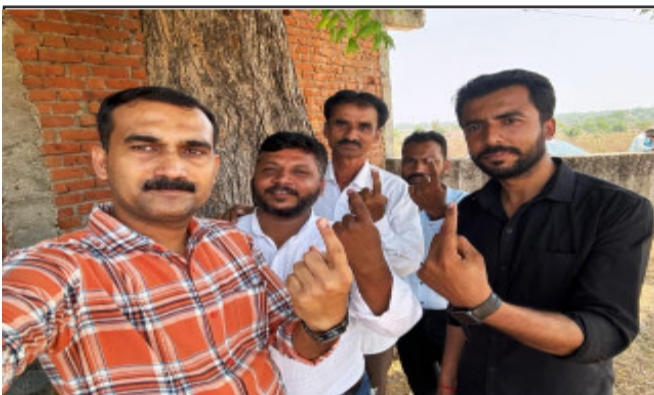
ખેડા લોકસભા બેઠક માટે પ્રાથમિક શાળા મતદાન મથક ખાતે વહેલી સવારે મતદારો મતદાન કરવા ઉમટ્યા. દિપસિંહ એમ ગઢવી, રિટાચર્ક પીએસઆઈ વોટ આપી કર્યા ગણેશાય.

નડિયાદ, મહિલા મતદાન સ્ટાફ દ્વારા લોકસભા સામાન્ય ચૂંટણી ૨૦૨૪ માટે સમગ્ર ખેડા મતવિસ્તાર માટે મતદાન ચાલી રહ્યું છે ત્યારે ૧૨૦- કપડવંજ બેઠકના એમ.પી હાઈસ્કૂલ ખાતે તમામ વય જૂથના મતદારો દ્વારા વોટ આપી લોકશાહીનો ઉત્સવ મનાવવામાં આવી રહ્યો છે. અહીં મહિલા મતદારોને આકર્ષવા ૧૧૭- સખી સંચાલિત મતદાન બુથ તૈયાર કરવામાં આવ્યું છે. જેમાં ૦૫