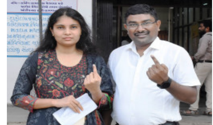
દાહોદ જિલ્લા ચૂંટણી અધિકારી યોગેશ નિરગુડેએ સહપરિવાર સાથે મતદાન કર્યું