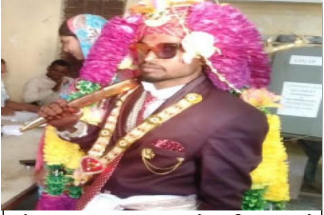
દાહોદના ધાનપુર તાલુકાના કોટમ્બી ગામ ખાતે લગ્ન કરવા જતા પહેલાં વરરાજાએ કર્યું મતદાન