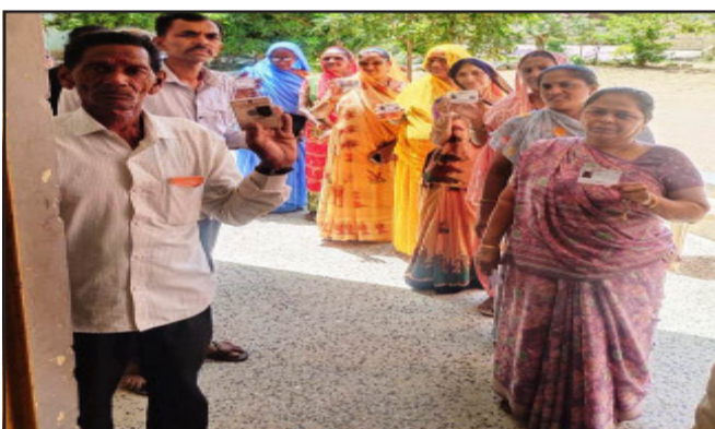
મલેકપુરમાં મતદારોએ ઉત્સાહભરે મતદાન કર્યું