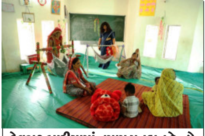
દેવગઢ બારીયામાં તમામ મતદાન કેન્દ્રો ખાતે નંદધર બનાવાયા