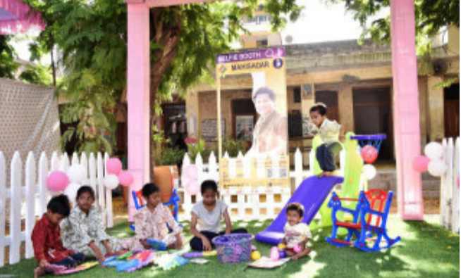
લુણાવાડા પંચશીલ હાઈસ્કૂલ સખી મતદાન મથક ખાતે નાના બાળકો માટે રમકડાની સુવિધા ઊભી કરવામાં આવી