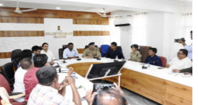
દાહોદ જિલ્લામાં ન્યાયી અને મુક્ત પાલો લોકસભાની ચૂંટણી યોજાય તે માટે પોલીસ તંત્ર દ્વારા તમામ પ્રકારની તૈયારીઓને પૂર્ણ કરી દેવામાં આવી છે. ત્યારે જિલ્લાના મતદાન મથકો પર ચુસ્ત પોલીસ બંદોબસ્ત અને સશસ્ત્ર સેનાના જવાનો સાથે શાંતિપૂર્ણ માહોલમાં અને ન્યાયિક પાલો ચૂંટણી યોજાય તે માટે જિલ્લા પોલીસવડા ડો. રાજદીપસિંહ ઝાલા દ્વારા માહિતી અપાઈ હતી. તો લોકસભાની ચૂંટણી જાહેર થઈ ત્યારથી લઈને આજ સુધી ૯,૯૬૭ લોકો સામે અટકાયતી પગલા લેવાયા છે જે લોકો અગાઉ અલગ અલગ ગુનાઓમાં સંકળાયેલા હતા ત્યારે

દાહોદ, દાહોદ જિલ્લામાં ન્યાયી અને મુક્ત પાલો લોકસભાની ચૂંટણી યોજાય તે માટે પોલીસ તંત્ર દ્વારા તમામ પ્રકારની તૈયારીઓને પૂર્ણ કરી દેવામાં આવી છે. ત્યારે જિલ્લાના મતદાન મથકો પર ચુસ્ત પોલીસ બંદોબસ્ત અને સશસ્ત્ર સેનાના જવાનો સાથે શાંતિપૂર્ણ માહોલમાં અને ન્યાયિક પાલો ચૂંટણી યોજાય તે માટે જિલ્લા પોલીસવડા ડો. રાજદીપસિંહ ઝાલા દ્વારા માહિતી અપાઈ હતી. તો લોકસભાની ચૂંટણી જાહેર થઈ ત્યારથી લઈને આજ સુધી ૯,૯૬૭ લોકો સામે અટકાયતી પગલા લેવાયા છે જે લોકો અગાઉ અલગ અલગ ગુનાઓમાં સંકળાયેલા હતા ત્યારે