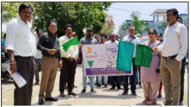
ગરબાડા મામલતદાર, તાલુકા વિકાસ અધિકારી, તાલુકાપ્રાથમિક શિક્ષણ અધિકારી અને તમામ વિભાગ દ્વારા આજ રોજ વધુ મતદાન કરવા મતદારોની સહભાગીદારી વધે તે હેતુથી મતદાન જાગૃતિ અભિયાન અંતર્ગત તાલુકા પર્યાયત કચેરી થી રેલીનું આયોજન કરવામાં આવ્યું.