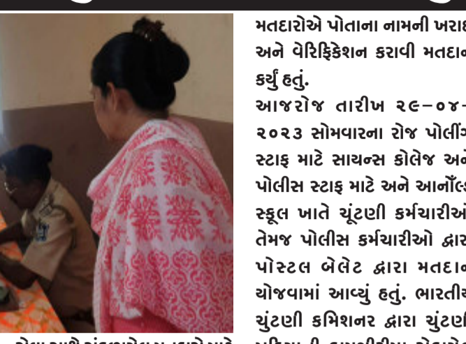
કચેરીએ પોસ્ટલ બેલેટ ઇસ્તુ કરવા માંગણી કરેલ છે તેવા મતદારોને મતદાન કરાવવા અને આવશ્યક સેવા સાથે સંકળાયેલ મતદારો માટે ફેસિલીટીશન સેન્ટર બનાવવામાં આવેલ હતું અને ત્યાં જઈ દરેક

ઝાલોદ, આવનારી ૦૭-૦૫-૨૦૨૪ મંગળવારના રોજ ગુજરાતમાં ચોખ્ખાની લોકસભાની ચૂંટણી અન્વયે ઝાલોદ તાલુકામાં સેન્ટ આર્નોલ્ડ તેમજ સાયન્સ કોલેજ ખાતે ચૂંટણીની કામગીરીમાં નિમણૂક થયેલ અધિકારી, કર્મચારીઓ, પોલીસ સ્ટાફ, ઝોનલ ઓફિસર, મદદનીશ ઝોનલ ઓફિસર, પોલીસ સ્ટાફ, રીસીવીંગ ડિસ્પેન્સરી સ્ટાફ તેમજ ૧૯ ઝાલોદ ( અ.જ.જા ) સંસદીય વિસ્તાર બહારના છે તેમજ જેમલો ફોર્મ ૧૨ ભરી ઝાલોદ