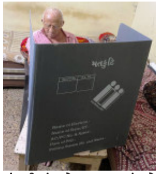
ચુંટણી તંત્ર તેમના ઘર આંગણે પહોંચ્યું હતું.

નડિયાદ, લોકસભા સામાન્ય ચુંટણી ૨૦૨૪માં વધુમાં વધુ મતદાન થાય તે માટે ખેડા જીલ્લા ચુંટણી તંત્ર દ્વારા મતદાન જાગૃતિ અર્થે વિવિધ કાર્યક્રમો કરવામાં આવી રહ્યા છે. તેમજ વૃદ્ધ અને દિવ્યાંગ મતદાતાઓ સરળતાથી મતદાન કરી શકે તે માટે અનેકવિધ સુવિધાઓ ઉપલબ્ધ કરાવવામાં આવી રહી છે. જે અંતર્ગત ભારતીય ચુંટણી પંચ દ્વારા ૮૫ વર્ષથી વધુ ઉંમરના વૃદ્ધજનો અને ૪૦%થી વધુ દિવ્યાંગતા ધરાવતા મતદારો ઘર બેઠાં પોસ્ટલ બેલેટથી મતદાન કરી શકે તેવી પહેલ કરવામાં આવી છે. જે અન્વયે ૧૭-ખેડા લોકસભા મતવિસ્તારના ૧૧૬- નડિયાદ વિધાનસભા મતવિસ્તારમાં ૮૫ વર્ષથી વધુ ઉંમરના નોંધાયેલા કુલ ૬૭ મતદારો પૈકી ૬૪ મતદારોએ મતદાન કર્યું. ઉપરાંત ૪૦% કરતાં વધુ દિવ્યાંગતા ધરાવતા નોંધાયેલા તમામ કુલ ૧૩ મતદારોએ મતદાન કર્યું. ઉદ્દેખનીય છે કે આગામી તા. ૩૦ એપ્રિલના રોજ ૧૧૮- મહુધા અને ૧૨૦ કપડવંજ વિધાનસભા મતવિસ્તારમાં હોમ વોટીંગ યોજશે.