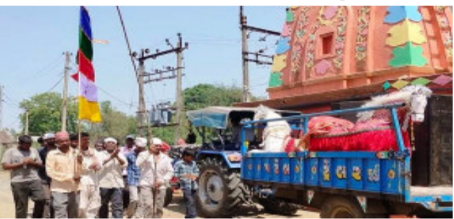
મલેકપુર, મહીસાગર જીલ્લાના લુણાવાડા તાલુકાના નાનાવડદલા ગામના જુની વસાહત અને નવી વસાહત ફળીયાના ભક્તજનો દ્વારા સેમારાના મુવાડા બસ સ્ટેન્ડ ખાતે આવેલ બાબા રામદેવપીરના મંદિરનો ૨૭ મો પાટોત્સવની આનંદ ઉદ્દાસ સાથે ઉજવણી કરવામાં આવી. પ્રાસ માહિતી અનુસાર નાનાવડદલા ગામના ગ્રામજનો તેમજ રામદેવપીર સુવક મંડળ દ્વારા બાબા રામદેવપીરના મંદિર ખાતે ૨૭ મો પાટોત્સવની આનંદ ઉદ્દાસ તેમજ ધામધૂમ સાથે ઉજવણી કરવામાં આવેલ હતી. બાબા રામદેવપીરના મંદિર ખાતે વહેલી સવારથી પુજા અર્ચના હવન કરી બાબા રામદેવપીરનો વરઘોડો કાઢવામાં આવેલ હતો.

પાકિસ્તાનમાં જજનું ફિલ્મી સ્ટાઈલમાં અપહરણ થતાં ખળભળાટ મચી ગયો ઈસ્લામાબાદ, પાકિસ્તાનની હાલત કેટલી ખરાબ છે તેનો અંદાજ જજના અપહરણ પરથી આવે છે. આતંકવાદીઓએ હવે જજનું અપહરણ કર્યું છે અને તેનો વિડીયો પણ જાહેર કરાયો છે. જેમાં જજ પોતાનો જીવ બચાવવા માંગણી કરતા દેખાય છે. વિડીયોમાં તે કહી રહ્યા છે કે પાકિસ્તાનના ચીફ જસ્ટીસે આતંકવાદીઓની વાત સ્વીકારવી જોઈએ. જજ પોતાની આઝાદી માટે વિનંતી કરે છે. એક મિનિટ લાંબી આ વિડીયો ક્લિપ પત્રકારોને મોકલવામાં આવી છે એ ક્લિપમાં જજ શકીરુલ્લા મારવત એકલા જોવા મળી રહ્યા છે. કાળા પડદાની સામે બેઠેલા જજ કહી રહ્યા છે કે તડરીક-એ-તાલીબાન પાકિસ્તાને તેમને બંધ બની લીધા હતા. તેમણે કહ્યું કે ટીટીપીની કેટલીક માંગણીઓ છે. જેની પાકિસ્તાનના ચીફ જસ્ટીસે વહેલી તકે પસાર થયું હતું. તેને ૯ ઓગસ્ટ ૨૦૧૯ ના રોજ રાષ્ટ્રપતિની મંજૂરી મળી, ત્યારબાદ જમ્મુ અને કાશ્મીરનો વિશેષ દરજ્જો દૂર કરવામાં આવ્યો.