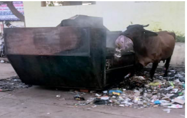
ગુલબાંગો કુકવામાં આવી રહ્યું હોય તેવું સ્પષ્ટ જોવા મળી રહ્યું છે.

લુણાવાડા, લુણાવાડા એસટી સ્ટેન્ડ ની અંદર ગંદકી અને કચરાના યોગ્ય નિકાલ માટે નગરપાલિકા દ્વારા એક કન્ટેનર મૂકવામાં આવ્યું છે. ત્યારે એકત્રિત થયેલો કચરો આજ સ્થાન ઉપર કન્ટેનરમાં જ સળગાવી દેવામાં આવતો હોવાથી એસટી સ્ટેન્ડમાં પ્લાસ્ટિક તેમજ કચરાને બળવાની માથા ફાડ દુર્ગંધથી આજુબાજુ બસની રાહ જોઈને ઊભા રહેલા મુસાફર જનતાને પારાવાર હાલાકી વેઠવી પડતી જણાઈ રહેલી જોવા મળી રહી છે.