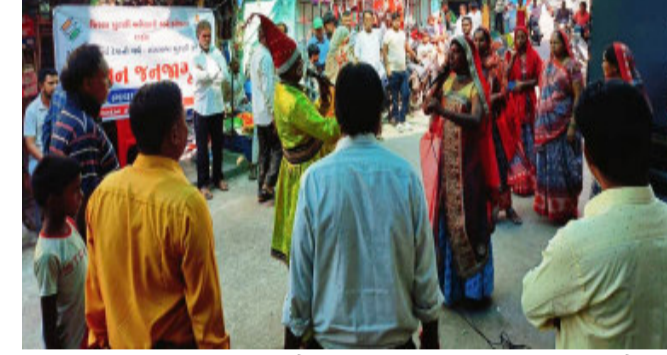
મતદારોએ પોતાના નામની ખરાઈ અને વેરિફિકેશન કરાવી મતદાન કર્યું હતું. આજરોજ તારીખ ૨૯-૦૪-૨૦૨૩ સોમવારના રોજ પોલીસ સ્ટાફ માટે સાયન્સ કોલેજ અને પોલીસ સ્ટાફ માટે અને આર્નોલ્ડ સ્કૂલ ખાતે ચૂંટણી કર્મચારીઓ તેમજ પોલીસ કર્મચારીઓ દ્વારા પોસ્ટલ બેલેટ દ્વારા મતદાન યોજવામાં આવ્યું હતું. ભારતીય ચૂંટણી કમિશનર દ્વારા ચૂંટણી પ્રક્રિયાની કામગીરીમાં રોકાયેલ તમામ લોકોનું તબક્કા વાર મતદાન યોજવામાં આવી રહેલ છે.