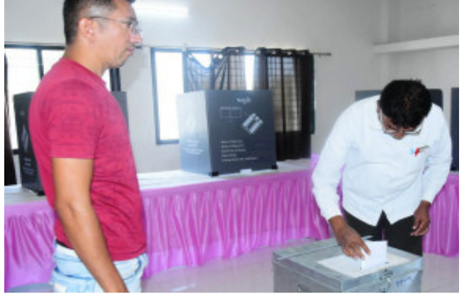
ચુંટણી અધિકારી અને કલેક્ટરના માર્ગદર્શનમાં જીલ્લામાં લુણાવાડા, બાલાસિનોર અને સંતરામપુર એમ ત્રણ વિધાનસભા મત વિભાગ મુજબ તૈયાર કરાયેલા મતદાન

લુણાવાડા, લોકસભા સામાન્ય ચુંટણી ૭મી મે ૨૦૨૪ના રોજ યોજાનાર છે ત્યારે પોતાના અઠાડ પ્રચલનો, પ્રતિબદ્ધતા, સમર્પણ અને સખત મહેનત થકી મુક્ત, ન્યાયી, નિષ્પક્ષ અને પારદર્શી ચુંટણીઓ સંપન્ન કરવામાં જે મનુ પાયાનું અને ખુબ જ મહત્વનું યોગદાન છે. એવા ચુંટણી ફરજ પર રોકાયેલા કર્મચારીઓ મતદાનથી વંચિત ન રહી જાય તે માટે ભારતના ચુંટણી પંચ દ્વારા તેમને પોસ્ટલ બેલેટથી મતદાનની સુવિધા આપવામાં આવે છે. જેના અનુસંધાને મહીસાગર જીલ્લા