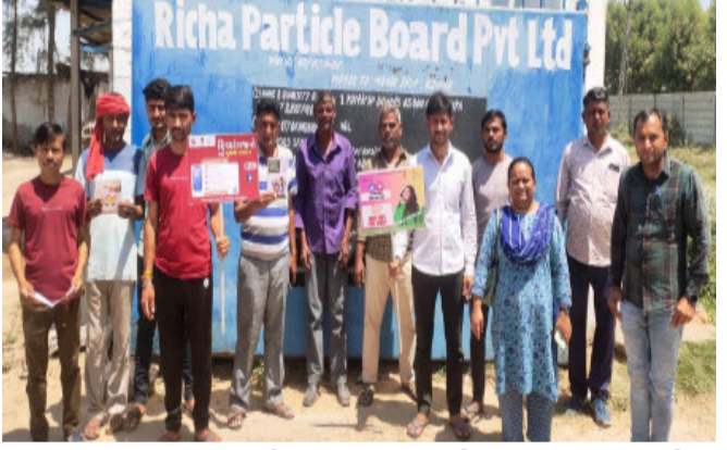
નડિયાદ, લોકસભા સામાન્ય ચુંટણી અંતર્ગત મતદાન જાગૃતિ માટે SVEEP કાર્યક્રમ કરવામાં આવે છે. તેને અનુલક્ષીને જિલ્લા શિક્ષણ અધિકારી કચેરી નડીયાદ તેમજ ગુજરાત પ્રદૂષણ નિયંત્રણ બોર્ડ, નડીયાદના સંયુક્ત ઉપક્રમે