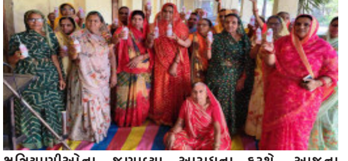
ક્ષત્રિયાણીઓના જણાવ્યા મુજબ આ આંદોલનમાં ભાઈઓનું મનોબળ મજબૂત કરવા માટે તેઓ આખો દિવસ ફક્ત પાણી પર રહેશે અને મા શકિતની આરાધના કરશે. આજના ઉપવાસ આંદોલન દરમિયાન ભજન કરશે હનુમાન ચાલીસા પણ કરશે. આ લડાઈ નારીની અસ્થિતાનો સવાલ હોઈ નહિ

કરીએ કોઈ સમાધાન, જય ભવાની ભાજપ જવાનીના સુત્રોચ્ચાર સાથે ક્ષત્રિયાણીઓ સમગ્ર વાતાવરણને ગુંજવું હતું. તો ભાજપના કોઈ કાર્યકરને ગામમાં પ્રવેશબંધી અંગે બેનર પણ લગાવવામાં આવ્યા છે. આજથી ક્ષત્રિયા સમાજ દ્વારા ધર્મરક્ષ શરૂ કરવાનું આયોજન છે. ત્યારે જિલ્લાના ક્ષત્રિયા સમાજમાં અસ્થિતા આંદોલન વેગ પકડી રહ્યું છે. આ આંદોલન ગામે ગામ પ્રસરે તેમ હાલ જણાઈ રહ્યું છે.