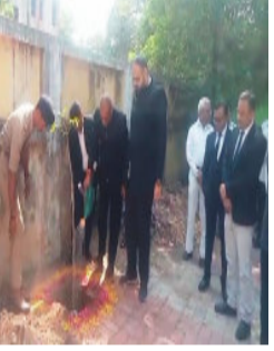
બાર એસોસીએશનના પ્રમુખ