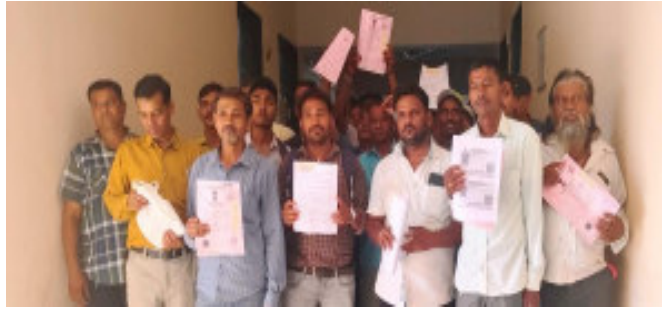
મામલતદાર કચેરીના એટીવીટી સેન્ટર ખાતે અરજદારોની લાંબી લાઈન આવકના દાખલા અને જાતિના દાખલા માટે લાઈનમાં ઉભા રહેતા હોય છે. તેમાં પણ ધરમધકકા પડતા હોય છે. ત્યારે આજરોજ ગોધરા

ઓપરેટર ચાલ્યો ગયેલ હોય જેને લઈ કલાકો થી લાઈનમાં ઉભેલ અરજદારો દ્વારા હોબાળો મચાવ્યો હતો. મામલતદાર કચેરીના એટીવીટી સેન્ટરમાં આખો દિવસ લાઈનમાં ઉભા રહેવા છતાં અરજદારોનું કામ થતું ન હોવાથી અરજદારોને માનસીક અને આર્થિક નુકશાન થઈ રહ્યું છે. ત્યારે મામલતદાર કચેરીના એટીવીટી સેન્ટરમાં પૂર્ણકાલીન કોમ્પ્યુટર ઓપરેટર મુકવામાં આવે તેવી માંગ અરજદારો દ્વારા કરવામાં આવી છે.