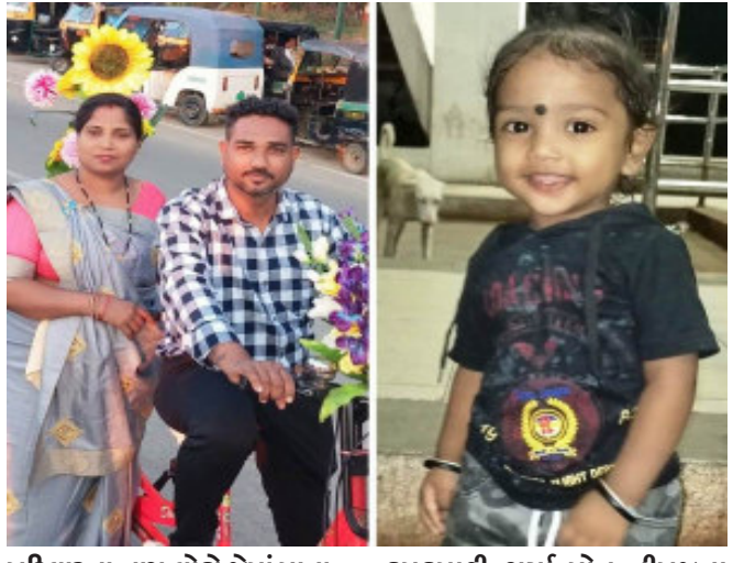
પરિવારના ત્રણ લોકો જેમાં માતા-પિતા અને પુત્ર સહિત ગઈકાલે બનેલી ગોઝારી ઘટનામાં તેઓના કમકમાટી ભર્યા મોત નીપજતા પરિવારમાં આભ તૂટી પડ્યું હતું. ઉલ્લેખનીય છે કે, ગઈકાલે જે

ગોઝારી ઘટના બની હતી. તેમાં માતા-પિતા અને પુત્ર સહિત મોતના કારણે પોતાની બંને દીકરીઓને નિરાધાર મૂકી ચાલ્યા જતા દીકરીઓ ઘુસકે ઘુસકે રડી રહી હતી. અમદાવાદ વડોદરા એક્સપ્રેસ હાઈવે ઉપર ટ્રેલર અને કાર વચ્ચે ગમખવાર અકસ્માતમાં ૧૦ જેટલા લોકોનું કમકમાટી ભર્યા મોત થતાં મોતની ચિરચારિયો ગુજી ઉઠી હતી. જેમાં પંચમહાલ જીલ્લાના ગોધરા તાલુકાના જીતપુરા ગામે રહેતા એક જ પરિવારના ત્રણ સભ્યો સામાજિક પ્રસંગ પતાવીને પોતાના સંબંધીને ત્યાં હાલોલ થી અમદાવાદ