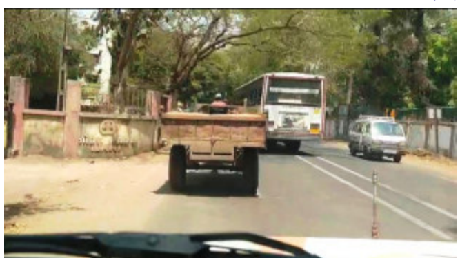
ગેરકાયદેસરની ખનિજ ચોરીને રોકવા માટે જીલ્લા ખાણ-ખનિજ વિભાગ દ્વારા દિવસ અને રાત્રીના સમયે એવા સ્થળો અને માર્ગો

ગોધરા, ગોધરાના ગોન્દ્રા વિસ્તાર માંથી ખાણ-ખનિજ વિભાગ દ્વારા ગેરકાયદેસર રીતે રેતી ભરીને પસાર થતાં ટ્રેક્ટર સહિત ૫ લાખના મુદ્દામાલ ઝડપી પાડવામાં આવ્યો હતો અને ટ્રેક્ટર કલેક્ટર કચેરી કંપાઉન્ડમાં સીઝ કરી દંડનીય કાર્યવાહી હાથ ધરવામાં આવી છે. પંચમહાલ જીલ્લામાં ગેરકાયદેસર રીતે ખાણ-ખનિજ માફિયાઓ દ્વારા રેતી, પથ્થર, માટીનું ખનન કરીને પાસ પરમીટ વગર ચોરી કરતા હોય છે. આવી