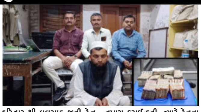
હરિદ્વાર થી વલસાડ જતી ટ્રેન રોકાઈ હતી. રેલ્વે પોલીસ અને એફ.એસ.ટી.ની ટીમ દ્વારા ટ્રેનની તપાસ કરાઈ હતી. ત્યારે ટ્રેનના કોચ એસ-૧ની સીટ નંબર-૨૩ ઉપર બેસી મુસાફરી કરતાં અને

ગોધરા, હરિદ્વાર થી વલસાડ જતી ટ્રેનને સિગ્નલ નહિ મળતાં ગોધરા રેલ્વે સ્ટેશન ખાતે રોકાઈ હતી. રેલ્વે પોલીસ દ્વારા તપાસ કરવામાં આવી હતી. તપાસ દરમિયાન મેરઠ થી અમદાવાદ જતા વ્યક્તિ પાસેથી ૧૩.૫૦ લાખ રોકડા ઝડપાઈ જતાં રેલ્વે પોલીસ દ્વારા ઈન્કમટેક્સને જાણ કરવામાં આવી. ગોધરા રેલ્વે સ્ટેશન ખાતે સિગ્નલ નહિ મળતાં