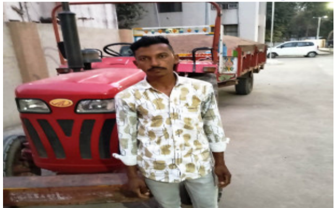
કચેરી ખાતે સીઝ કરવામાં આવ્યું. ગોધરા પ્રાંત અધિકારી અને પંચમહાલ જીલ્લા ખાણ-ખનિજ વિભાગની ટીમ દ્વારા બાતમીના આધારે બાયપાસ હાઇવે રોડ ઉપર ચેકીંગ હાથ ધરવામાં આવ્યું હતું.

ગોધરા, ગોધરા પ્રાંત અધિકારી અને ખાણ-ખનિજ વિભાગની ટીમ દ્વારા બાયપાસ હાઇવે રોડ ઉપર બાતમીના આધારે સંયુક્ત ઓપરેશન હાથ ધરવામાં આવ્યું હતું. ચેકીંગ દરમિયાન રેતી ભરેલ ટ્રેક્ટરને રોકી પરમીટની માંગણી કરતાં પરમીટ આપી શક્યા ન હતા. જેથી ખાણ-ખનિજ વિભાગની ટીમે રેતી ભરેલ ટ્રેક્ટર સહિત પાંચ લાખના મુદ્દામાલ સાથે એક ઈસમને ઝડપી પાડવામાં આવ્યો. ઝડપી પાડવામાં આવેલ ટ્રેક્ટરને પ્રાંત ગોધરાના ગોન્દ્રા પોરવેલ મોલ પાસે પ હજાર રૂપિયા પરત નહિ આપતા આરોપીએ ચપ્પુના ધા ઝીંકી ઈજાઓ પહોંચાડતા ફરિયાદ