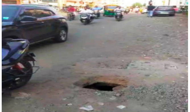
કરવામાં આવે તેવી માંગ ઉઠવા પામી છે. બીજીથી પ્રભારોડ સુધી ફ્લાય ઓવર બ્રીજ નિર્માણ કાર્યમાં ટ્રાફિક સમસ્યાઓને દૂર કરવા માટે

ગોધરા, ગોધરા શહેરમાં ફ્લાયઓવર બિંજના નિર્માણ કાર્ય માટે વાહનો થી સતત ધમધમતા હાર્દસમા એવા પેટ્રોલ પંપથી ગાંધી ચોક સુધી વાહન ચાલકો માટે આપવામાં આવેલા ડાયવર્ઝન રોડ ઉપર વધુ એક ભુવોજો વ્યવસ્થા જાડો પડતા વાહન ચાલકો ગભરાઈને લાગણી છવાઈ ગઈ છે અને ભુવો પડે તો જવાબદારી કોની તે પણ સવાલ આમ જનતામાં ઘર્ષ રહ્યો છે. ત્યારે આ મામલે સમારકામ