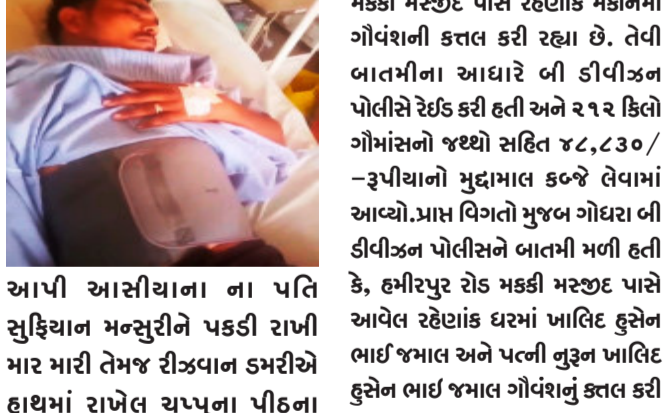
આપી આસીયાના ના પતિ સુફિયાન મન્સુરીને પકડી રાખી માર મારી તેમજ રીઝવાન ડમરીએ હાથમાં રાખેલ ચપ્પુના પીઠના ભાગે ત્રણ ધા મારી ઈજાઓ પહોંચાડી હતી. અને આજે બચી ગયો છે હવે મળ્યો તો જાનથી મારી નાંખવાની ધમકી આપી ગુનો કરતા આ બાબતે ગોધરા બી-ડીવીઝન પોલીસ મથકે ફરિયાદ નોંધાવવા પામી છે.

ગોધરા, ગોધરાના ગોન્દ્રા પોરવેલ મોલની બાજુમાં આરોપીઓ ફરિયાદીના પતિને કહેલ કે, મારા પ હજાર ઉછીણા લીધેલા તે પૈસા માંગતા પૈસા નહિ આપતા ત્રણેય આરોપીઓ ગાળો આપી ચપ્પુના ધા મારી ઈજાઓ પહોંચાડતા ફરિયાદ નોંધાવવા પામી છે.