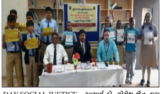
DAY SOCIAL JUSTICE વિશ્વ સામાજિક ન્યાય દીન ની ઉજવણી અંતર્ગત પોદાર ઈન્ટરનેશનલ સ્કૂલ ખાતે અભ્યાસ કરતાં વિદ્યાર્થીઓને બાળકો - મહિલાઓને લગતાં કાયદાઓ તથા મફત અને સક્ષમ કાનૂની સેવાઓ વિશેની માહિતી આપવાના હેતુસર એક વિશેષ જનજાગૃતિ કાર્યક્રમનું આયોજન કરવામાં આવ્યું હતું. આજનાં આ કાર્યક્રમના ચર્ચમાન તરીકે પોદાર ઈન્ટરનેશનલ સ્કૂલ નડીયાદનાં