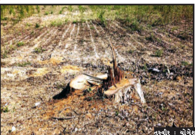
તસ્વીર : યોગેશ કનોજીયા, ઘોઘંબા

ઘોઘંબા, તાલુકો ગેર કાયદેસર લાકડાની તસ્કરી કરતા વેપારીઓ માટે સ્વર્ગ સમાન છે ગોધરા, વેજલપુર, કાલોલ, હાલોલ તેમજ દાહોદ તથા છોટાઉદેપુર જિલ્લાના વેપારીઓ ઘોઘંબાના ગ્રામ્ય વિસ્તારોમાં પડાવ નાખી પ્રતિબંધિત વૃક્ષોનું કટીંગ કરી ટેમ્પા તથા ટ્રેક્ટરો મારફતે અન્ય તાલુકા અને જિલ્લાઓમાં પહોંચાડી રહ્યા છે. ખરોડ નવા બ્રિજ તરફ જવાના રસ્તા ઉપર આવેલ રોડ ની બાજુમાં આવેલ ખેતર માથે લાકડાઓનો સાગ કાપી ગયા પરંતુ ઠૂંકા રહી જતાં કેમેરામાં કેદ થયા છે શું? વન વિભાગ તપાસ કરશે ખરી