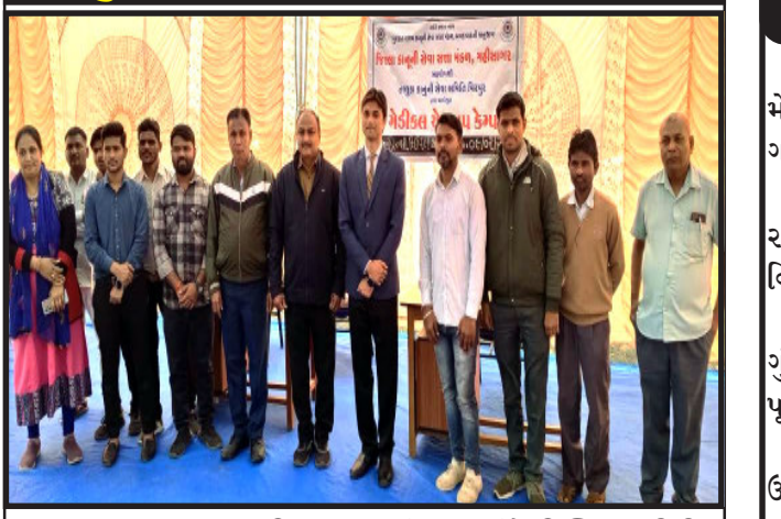
તસ્વીર : ભૌમિક પટેલ, વિરપુર

વિરપુર, વિરપુરની સીવીલ કોર્ટ ખાતે જિલ્લા કાનૂની સેવા સત્તા મંડળ મહિસાગર અને વિરપુર તાલુકા કાનૂની સેવા સમિતિના સંયુક્ત ઉપક્રમે મેડિકલ ચેકઅપ કેમ્પ યોજાયો હતો. રાષ્ટ્રીય બાલ સ્વાસ્થ્ય કાર્યક્રમ અંતર્ગત મેડિકલ કેમ્પનું આયોજન કરવામાં આવ્યું. જેમાં કોર્ટના કોર્ટના વકીલ એશોરીશિયન તેમજ સ્ટાફે બી.પી ચેકઅપ કરાવ્યું