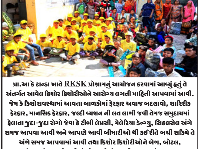
પ્રા. આ કે ટાન્ડા ખાતે RKSK પ્રોજામનું આયોજન કરવામાં આવ્યું હતું તે અંતર્ગત આવેલ કિશોર કિશોરીઓને આરોગ્ય લગતી માહિતી આપવામાં આવી. જેમ કે કિશોરોવચ્ચમાં આવતા બાળકોમાં ફેરફાર અવાજ બદલાવો, શારિરીક ફેરફાર, માનસિક ફેરફાર, જલ્દી વ્યથન ની લત લાગી જવી તેમજ સમુદાયમાં ફેલાતા બુદા-બુદા રોગો જેવા કે ટીબી લેપ્ટોસાઈટ, મેલેરિયા કેન્સર, સિકલસેલ અંગે સમજ આપવા આવી અને આપણે આવી બીમારીઓ ઠી કરી રીતે બચી શકીએ તે અંગે સમજ આપવામાં આવી તથા કિશોર કિશોરીઓને બેગ, બોટલ, કાંપાસબોક્સ, ટી-શર્ટ, ટોપી આપી પ્રોત્સાહિત કરવામાં આવ્યા.