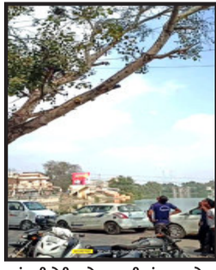
પતંગની દોરી અને વાયરની અંદર ફસાયેલા સમડીનું દિલઘડક રેસ્ક્યુ કરી પતંગની દોરીમાંથી કાઢી જીવદયાની ટીમને સોંપવામાં આવ્યો હતો. આમ, ફાયર બ્રિગેડની સરાહનીય કામગીરીને ગોધરાની જનતાએ બિરદાવી હતી. કારણ કે, ફાયર બ્રિગેડની ટીમ આગજન્ય બનાવો સાથે સાથે આવા દિલઘડક રેસ્ક્યુ કરીને પણ અબોલ પહોંચીને બચાવવાની કામગીરી કરતા જીવદયા પ્રેમીઓએ તેમની કામગીરીના વખાણ કર્યા હતા.

ગોધરા, ગોધરા શહેરમાં આવેલા રામસાગર તળાવ પાસે આવેલ હોળી ચકલા પાસે એક પીપળાના ઝાડ ઉપર પતંગની દોરીમાં સમડી ફસાયેલી હાલતમાં લટકી રહ્યાની વર્દી ગોધરા ફાયર બ્રિગેડના પહોંચી પતંગની દોરીમાં લટકી રહેલા સમડીનું દિલ ઘડક રેસ્ક્યુ કરવામાં આવ્યું હતું. જેમાં ફાયર બ્રિગેડના જવાનોએ કલાકોની જહેમત બાદ પતંગની દોરીમાં ફસાયેલા સમડીને કાઢી આબાદ રીતે બચાવી લેવામાં આવી હતી અને તાત્કાલિક જીવદયાની ટીમને સોંપવામાં આવ્યો હતો. ગોધરા શહેરમાં ફાયર બ્રિગેડ