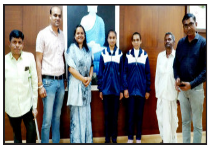
આવડતોની આપ-લે બીજા રમતવીર સાથે કરી શકે અને તેમને સમાજ સાથે એકરૂપ થવાની સમાન તકો પ્રાપ્ત થાય

મહિસાગર, નવી દિલ્હી ખાતે તાજેતરમાં યોજાયેલ સ્પેશિયલ ઓલિમ્પિક્સની ફ્લોર બોલની રમતમાં ગુજરાતની ટીમની સાત મનોદિલ્ચાંગ દીકરીઓએ ગોલ્ડ મેડલ મેળવી સમગ્ર દેશમાં ગૌરવશાળી સ્થાન પ્રાપ્ત કર્યું છે. આ સિદ્ધિમાં મહિસાગર જીલ્લાના ખાનપુર તાલુકાના વડાગામ કલસ્ટરની બે દીકરીઓના ઉજ્જવલ પ્રદર્શનનો સમાવેશ હોવાથી રાષ્ટ્રીય કક્ષાએ જીલ્લાનું નામ રોશન કરવા બદલ