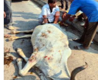
અને તુરંત પશુને જરૂરિયાત પ્રમાણે સારવાર પુરી પાડી હતી અને મોતનાં મુખ માંથી બચાવી લીધી હતી. સમયસર સારવાર મળી જતા ગાય નો જીવ રચ્યો હતો. સારવાર કર્યા બાદ ઘાયલ પશુને પરવડી પાંજરાપોળ ગોધરા ખાતે ખસેડાઈ હતી. આ કાર્યમાં EMRI ઝીન હેલ્થ સર્વિસની ૧૯૬૨ની સેવા સાથા અર્થમાં એક ગાય માટે વરદાનરૂપ નિવડી હતી.