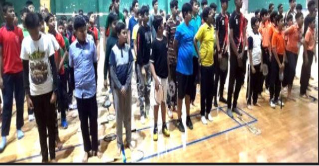
ગોધરા, રાજ્યના યુવાનોને સર્વોચ્ચ શિક્ષણ માટે મહાકુલ આજે રમત ગમત ક્ષેત્રે પ્રોત્સાહન આપવા માટે રાજ્ય સરકાર દ્વારા ખેલમહાકુલ શરૂ કર્યો હતો. આજરોજ જિલ્લાકક્ષાની બેડમિન્ટન સ્પર્ધાનું આયોજન ગોધરા ખાતે કરવામાં આવેલ.