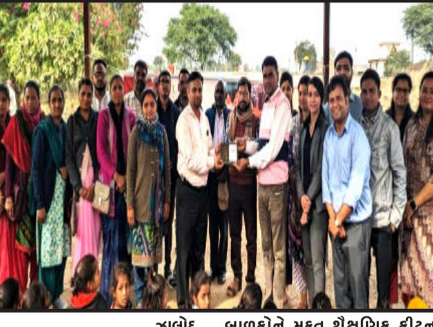
ઝાલોદ, ઝાલોદ તારીખ ૧૦મી જાન્યુઆરી ૨૦૨૩ના રોજ ગંગાદિયા વર્ગ ડુંગરી પ્રા.શાળામાં મહત્વ અર્પણ થયું. દિપક, દિપક અને ગંગાદિયા વર્ગ ડુંગરી પ્રા.શાળામાં આંખની મહત્વ તપાસ માટેનો કેમ્પ યોજવામાં આવ્યો. જેમાં શાળાના બાળકો, શિક્ષક અને ગામ માંથી વાલીઓએ આંખની મહત્વ તપાસ કરાવી હતી. જેમને નંબર હોય તેમને મહત્વ ચર્ચા આપવામાં આવ્યા. વ્યક્ત કરી કેમ્પનું સમાપન કરવામાં આવ્યું.

વાલ ચાલુ બંધ કરવામાં આવે તો આ સમસ્યાનો અંત આવી શકે તેમ છે, પરંતુ આવું કરવામાં આવતું નથી. બીજી તરફ ટાંકાની પાસે જ ચોકીદારને રહેવા માટે રૂમ પણ આપેલ છે, પરંતુ અહીંયા કોઈ ચોકીદાર ન હોવાના કારણે રૂમના બારી દરવાજા ચોરાઈ ગયા છે. તેમ જ ટાંકાની ઉપર બનાવવામાં આવેલ તમામ ઢાંકણા પણ ચોરાઈ ગયા છે. જેને આજ દિન સુધી બેસાડવાની તરતી લેવામાં આવી નથી. અંદાજીત ૩૦ થી ૩૫ લાખ લિટરની ક્ષમતાવાળા આ ટાંકા ઉપર ઢાંકણા તેમજ ચોકીદાર ન હોવાના કારણે કોઈ ગંભીર અકસ્માત બની શકવાની શક્યતાઓ પણ જોવા મળી રહી છે. જે બાબતથી લાગતા વળગતા અધિકારીઓ વાકેફ હોવા છતાં પણ આંખ આડા કાન કરતા હોવાનું જોવા મળી રહ્યું છે.