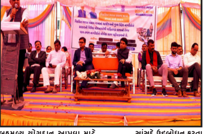
બહુમૂલ્ય યોગદાન આપવા માટે સામુહિક શપથ લીધા હતા.