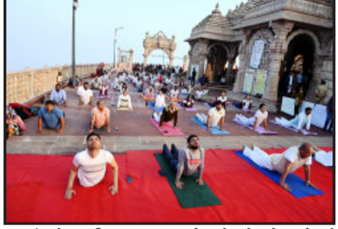
જીદામાં આવેલ સુપ્રસિદ્ધ યાત્રાધામ અને આઈકોનિક સ્થળ પાવાગઢ મંદિર પરિસર ખાતે સૂર્યનમસ્કાર