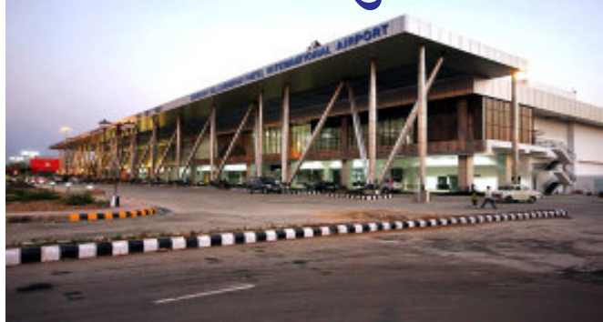
અમદાવાદ એરપોર્ટ પરથી શાહજહેબ ઈસ્ફાન અહમદ નામના

પોલીસ ટીમ દોડતી થઈ ગઈ હતી. જે પછી સુરક્ષાકર્મચારીઓ દ્વારા બોમ્બની ચકાસણી કરવામાં આવી હતી. શાહજહેબ ઈસ્ફાન અહમદની પછ ચકાસણી અને પુછપરછ કરવામાં આવી હતી.