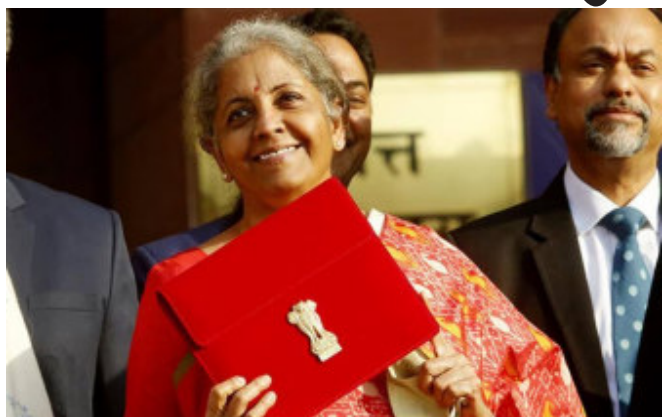
યુવાનો, ખેડૂતો અને મહિલા શક્તિ પર રહેશે. આવી સ્થિતિમાં, સરકાર બજેટમાં આ ચાર શ્રેણીઓ પર ધ્યાન

જેમાં મહિલાઓની ભાગીદારી પણ વધી રહી છે. જો સરકાર બજેટમાં ટેક્સ સિસ્ટમમાં કોઈ ફેરફાર કરે છે, ટેક્સ છૂટની મર્યાદામાં ફેરફાર કરે છે અથવા ટેક્સ માટે સ્ટાન્ડર્ડ ડિડક્શનની મર્યાદામાં વધારો કરે છે તો તે યૂંટણીની ભેટથી ઓછી નહીં હોય. તમને જણાવી દઈએ કે ગત બજેટ એટલે કે ૨૦૨૩-૨૪ના બજેટમાં કેન્દ્રીય નાણા મંત્રી નિર્મલા સીતારમણે ૭ લાખ રૂપિયા સુધીની વાર્ષિક આવક ધરાવતા લોકોને નવા કરવેરા વ્યવસ્થા હેઠળ ટેક્સમાંથી બહાર રાખવાનો નિર્ણય કર્યો હતો. નાણાપ્રધાને નવી કર વ્યવસ્થામાં કર મુક્તિ મર્યાદા રૂ. ૧૦