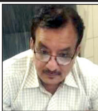
સુંચારું કાર્ય કરવાનો બહોળો અનુભવ દેખવા મળી રહ્યો છે. જેથી તેમણે વિજીટર રજીસ્ટરની અમલવારી શરૂ કરીને અનોખું ઉદાહરણ પુરું પાડ્યું છે. જેથી સરકારી હોસ્પિટલની તમામ

દે.બારીયા, દે.બારીયા તાલુકા તેમજ પંથકનું સ્ટેટ રજવાડીના સમયનું પ્રખ્યાત સરકારી હોસ્પિટલમાં ગણના થતી હતી. ૮૦ના દશકામાં જે મોટી સર્જરીના ઓપરેશન મુંબઈ ખાતે થતા હતા. તેવા સર્જરી ઓપરેશન જે.એસ. ચૌહાણ સરકારી હોસ્પિટલમાં ૧૯૮૦ની સાલમાં વિના મુલ્યે કરવામાં આવતા હતા. તે સમયના સુપ્રિટેન્ડન્ટ પોતાની ફરજમાં આવતા કાર્યો કરવામાં ખંતીલાપણું અપનાવતા હતા. હાલમાં નવા આવેલા સુપ્રિટેન્ડન્ટને માંડ પાંચ થી છ માસ થયા હશે પણ તેમનામાં