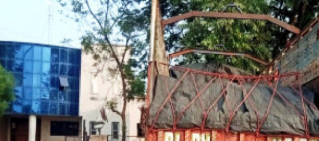
કાલોલ, કાલોલ ની ગોમા નદીમાંથી ખુદેઆમ ઠેક ઠેકાણે ખનન માફીયા દ્વારા રેતી આને માટીનું ખનન અને વહન કરવામાં આવી રહ્યું છે જે ખનીજ ચોરીને મળેલ ફરિયાદ સબબ કાલોલ તાલુકાના મલાવ રોડ ઉપર નજીક આવેલ ગોમા નદીના પટમાંથી ગેરકાયદે રીતે વહન કરી