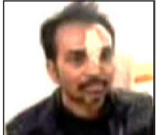
જાહેરમાં ઘુંકવું નહીં ત્યારે આવેશમાં આવેલા ઈસમે તબીબ ઉપર હિયકારો હુમલો કરતા મોઢાના ભાગે ગંભીર પ્રકારની ઈજાઓ પહોંચતા ચાર જેટલા ટાંકા આવ્યા હતા.

ગોધરા, ગોધરા શહેરમાં સિવિલ હોસ્પિટલમાં ફરજ બજાવતા તબીબ ઉપર નજીવી બાબતે હિયકારો હુમલો કરવામાં આવતા તબીબના મોઢાના ભાગે ગંભીર પ્રકારની ઈજાઓ પહોંચતા ચાર જેટલા ટાંકા આવ્યા હતા. જ્યારે સમગ્ર બનાવને લઈને હુમલો કરનાર ઈસમની અટકાયત કરી ગોધરા એ કિવિઝન પોલીસ મથકમાં મોકલી આપી વધુ કાર્યવાહી હાથ ધરવામાં આવી છે.